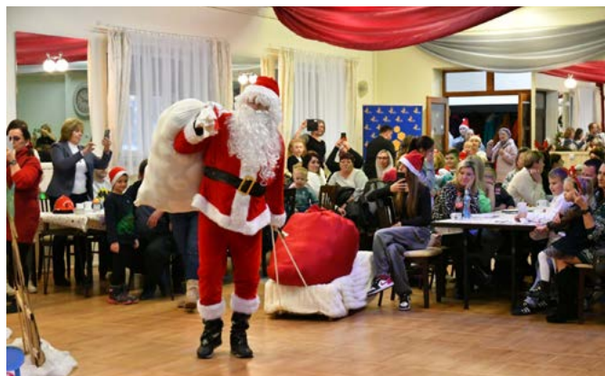
Mikołajki w Kisielowie