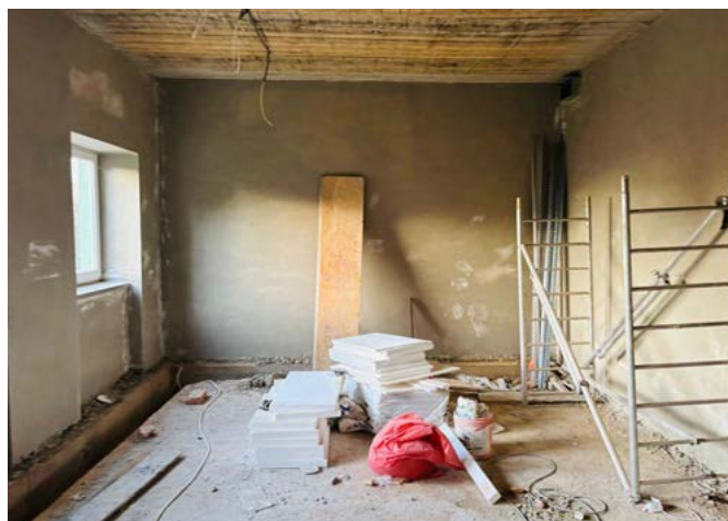
Remont przedszkola w Kisielowie