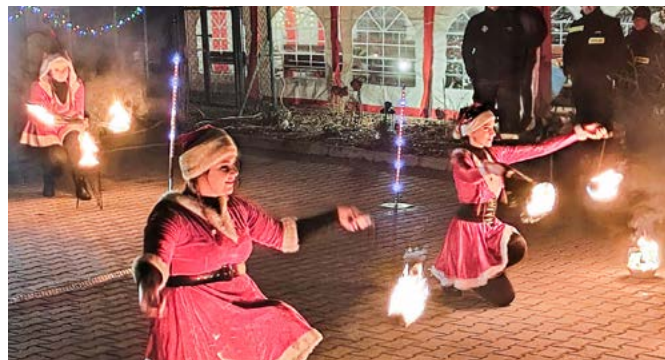
Rozświecenie choinki w Lesznej Górnej