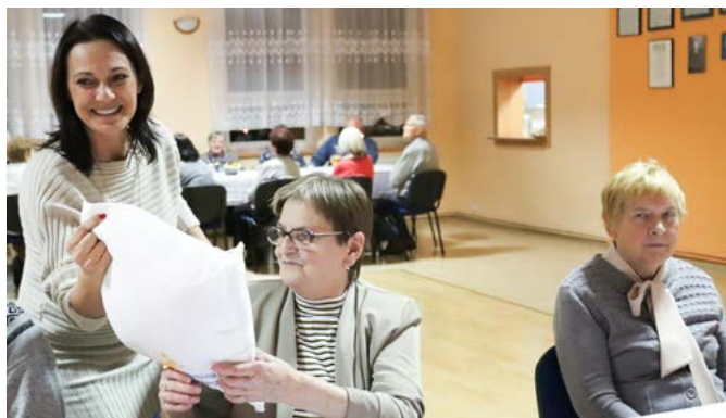
Spotkanie seniorów w Goleiszowie-Równi