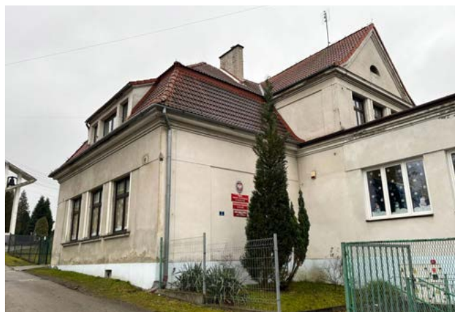
Przedszkole w Puńcowie