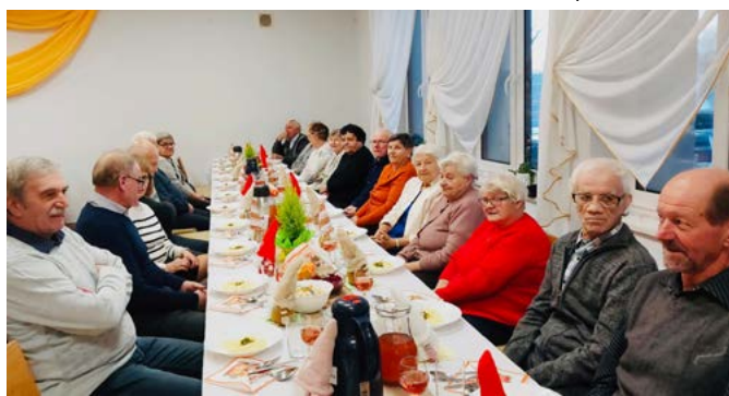
Spotkanie seniorów w Godziszowie