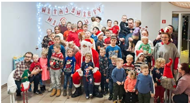
Mikołajki w Godziszowie