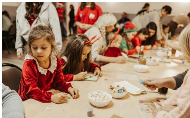
Mikołajki w Kozakowicach

W imieniu najmłodszych mieszkańców gminy Goleiszów serdecznie dziękujemy wszystkim osobom, organizacjom oraz sponsorom zaangażowanym w przygotowanie przedświątecznych atrakcji. Poniżej prezentujemy kilka zdjęć z opisanych wydarzeń.