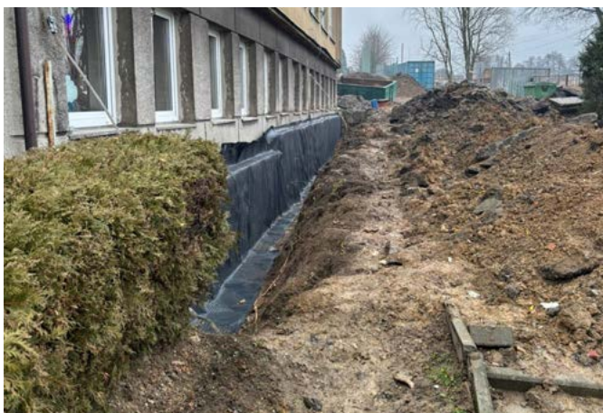
Remont dotychczasowego budynku szkoły w Bażanowicach