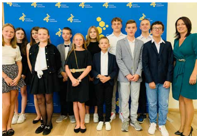
Radni Młodzieżowej Rady Gminy Goleiszów II kadencji