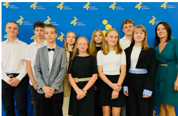
Radni Młodzieżowej Rady Gminy Goleiszów I kadencji