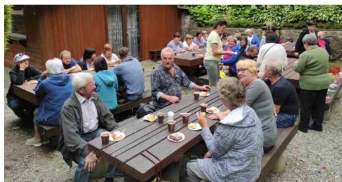
Część członków TMZG na zebraniu w Pszczelim Miasteczku