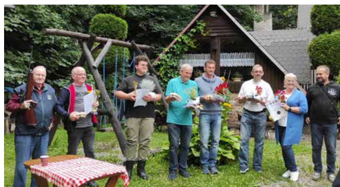
Najlepsi w zawodach strzeleckich