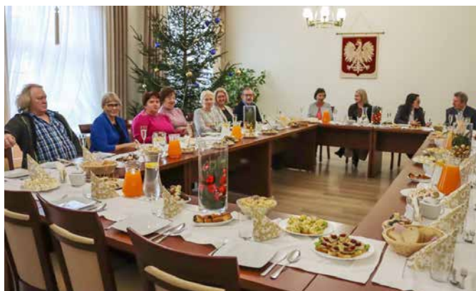
Z emerytowanymi pracownikami urzędu gminy