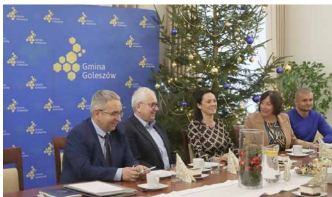
Z dyrektorami szkół i przedszkoli