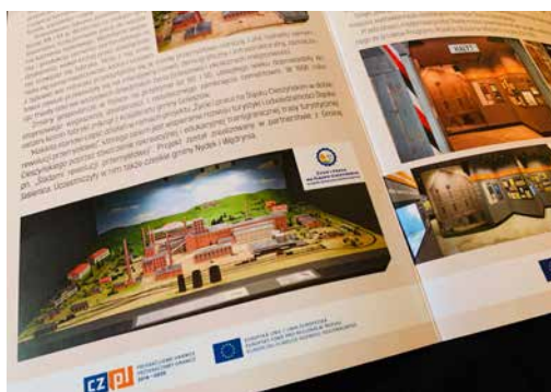
Makieta goleszowskiej fabryki cementu i Izba Oświęcimska

W trosce o bezpieczeństwo mieszkańców gminy w pierwszych miesiącach 2023 roku zainicjowane zostały także starania mające na celu utworzenie posterunku policji w gminie Goleszów. Postulaty mieszkańców oraz działania gminy w tym temacie wpisały się w program modernizacji służb podległych Ministerstwu Spraw Wewnętrznych i Administracji,