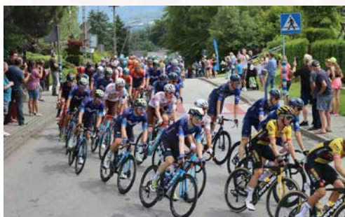
Przejazd Tour de Pologne przez gminę Goleszów

Wędkarskiego „TON”, 23. Dziecięco-Młodzieżowe Zawody Wędkarskie o Puchar Wójta Gminy Goleszów, XXV Świętojańskie Zawody Wędkarskie, XXXII Gminne Drużynowe Zawody Wędkarskie, zawody wędkarskie „Memoriał Jana Śliwki”, ogólnodostępne dziecięco-młodzieżowe zawody wędkarskie, Jesienne Zawody Wędkarskie oraz finałowe zawody wędkarskie strażaków ochotników w ramach rywalizacji o Puchar Prezesa Zarządu Oddziału Powiatowego ZOSP RP w Cieszynie. Równie dużym zainteresowaniem co zawody wędkarskie cieszyły się zawody strzeleckie organizowane na strzelnicy sportowej Koła Łowieckiego „Hubertus” w Goleszowie. W 2023 roku odbyły się m.in. otwarte zawody strzeleckie o Puchar Wójta Gminy Goleszów oraz otwarte zawody strzeleckie o Puchar Przewodniczącej Rady Gminy Goleszów.