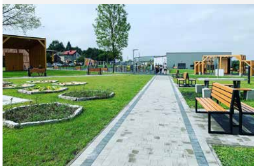
Teren rekreacyjny za Gminnym Ośrodkiem Kultury w Goleszowie

ną tężnią solankową i kurtyną wodną, miniamfiteatr, siłownia zewnętrzna, a także wiata, stojak i zestaw naprawczy dla rowerów oraz stacja do ładowania rowerów elektrycznych. Zrealizowanie tej ogromnej inwestycji przygotowawanej z myślą o mieszkańcach gminy Goleszów było możliwe dzięki środkom zewnętrznym. W minionym roku kompleksowy remont przeszedł także goleszowski orlik, który został dostosowany do wymagań sportowców w każdym wieku.