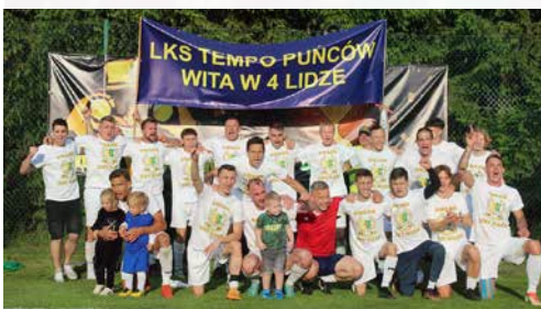
Drużyna LKS Tempo Puńców