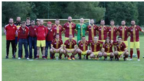
Drużyna LKS Goleszów

Przez cały rok rywalizowali także nasi gminni wędkarze, którzy licznie uczestniczyli w zawodach Towarzystwa Wędkarskiego „TON” w Goleszowie. W 2023 roku odbyły się m.in. Wiosenne Zawody Wędkarskie o tytuł mistrza Towarzystwa