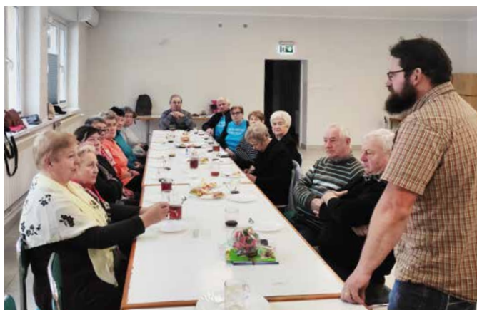
Spotkanie pod nazwą „Opowiem Wam historię. Dzięgielów to...”