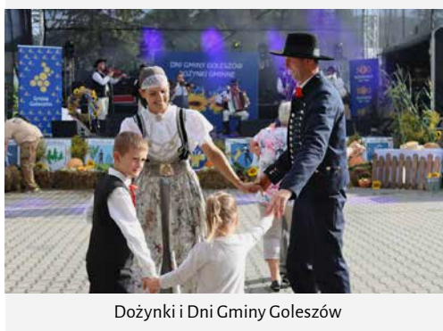
Dożynki i Dni Gminy Goleiszów

edycja Narodowego Czytania, które miało miejsce w plenerze, a dokładnie w naszym miniamfiteatrze za Gminnym Ośrodkiem Kultury w Goleiszowie, oraz uroczystości związane z Narodowym Świętem Niepodległości.