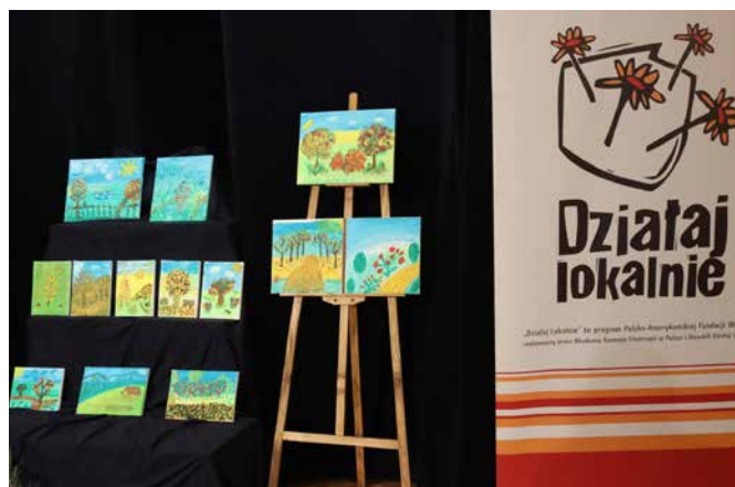
Wernisaż wystawy "Kolory Goleszowa"