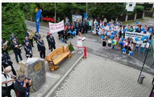
Jubileusz 800-lecia Puńcowa