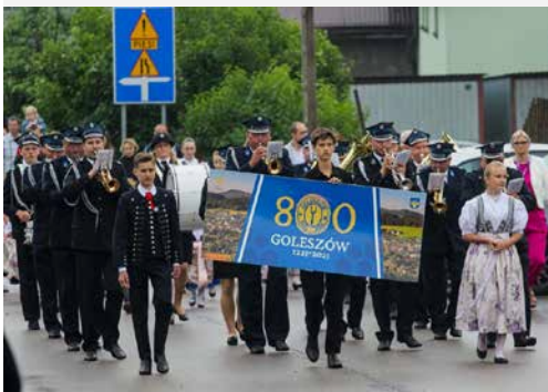
Jubileusz 800-lecia Goleszowa