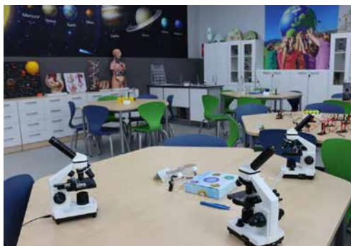
Zielona Pracownia w Zespole Szkolno-Przedszkolnym w Dziegielowie

Kolejny rok z rządu gmina Goleszów pozyskała dofinansowanie z Wojewódzkiego Funduszu Ochrony Środowiska i Gospodarki Wodnej w Katowicach z przeznaczeniem na utworzenie Zielonej Pracowni oraz Ekopracowni pod chmurką w Zespole Szkolno-Przedszkolnym w Dziegielowie. W sumie na oba te działania udało się pozyskać blisko 120 tys. zł. Konkurencja w obu konkursach była ogromna, więc sukces w tym zakresie smakuje jeszcze lepiej. A jeśli mowa o inwestycjach realizowanych z myślą o najmłodszych mieszkańcach naszej gminy, to nie można pominąć dwóch ważnych działań zrealizowanych w trakcie minionego roku. Pierwsze dotyczyło placu zabaw, który powstał w bezpośrednim sąsiedztwie Szkoły Podstawowej im. Pawła Stalmacha oraz przedszkola w Bażanowicach. Środki na ten cel pochodziły zarówno z budżetu gminy, jak i budżetu województwa śląskiego. Drugie, jeszcze większe działanie związane było z zagospodarowaniem terenu rekreacyjnego za Gminnym Ośrodkiem Kultury w Goleszowie. Powstały tam m.in.: ogromny plac zabaw, miejsce odpoczynku z ogólnodostęp-