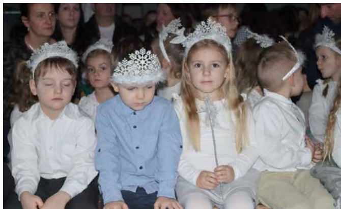
Ciąg dalszy zdjęć ze spotkania świątecznego w cisownickiej szkole