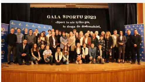
Goleszowska Gala Sportu 2023