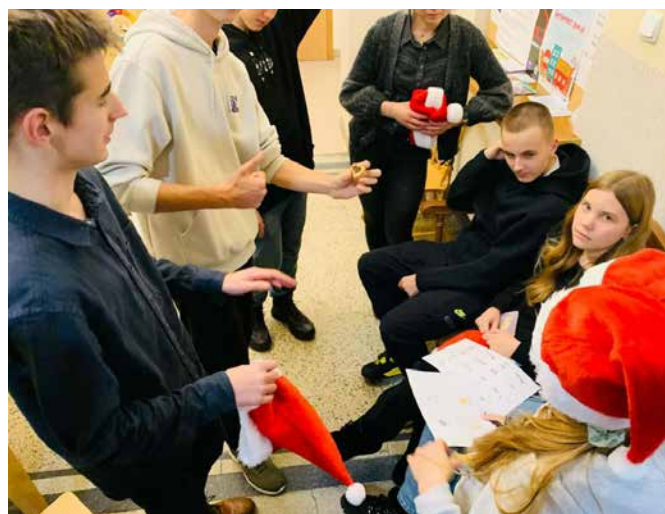
Młodzi radni debatują nad wyborem swojego logo

Jesienią zakończy się obecna kadencja Młodzieżowej Rady Gminy, ale nowe logo pozostanie jako inspiracja dla kolejnych grup młodych liderów zaangażowanych w działania na rzecz dzieci i młodzieży w gminie Goleszów.