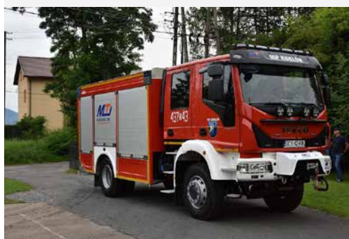
Nowy samochód ratowniczo-gaśniczy OSP w Kisielowie