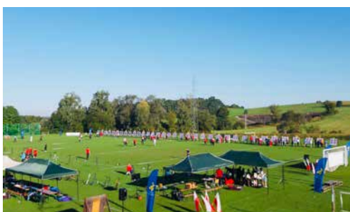
Mistrzostwa Polski Seniorów w Łucznictwie Bloczkowym i Barebow