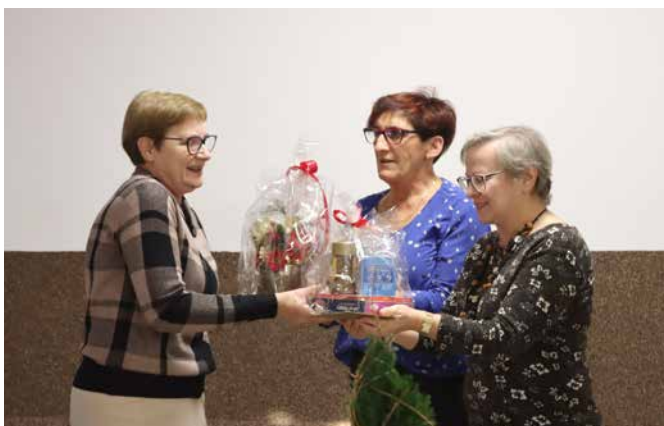
Spotkanie w Cisownicy