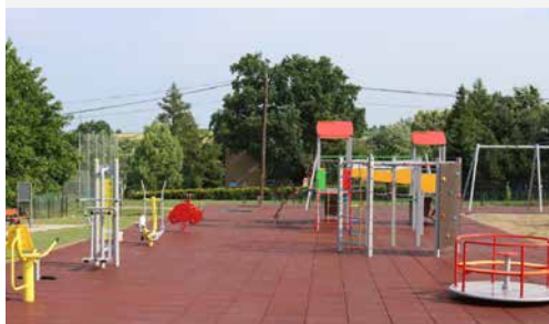
Plac zabaw w Bażanowicach