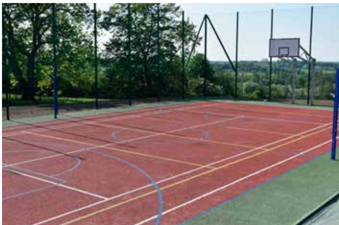
Boisko w Kisielowie

W ramach inicjatyw lokalnych, wspólnie z mieszkańcami, zrealizowano 11 projektów, m. in.: poszerzenie ul. J. Gajdzicy w Cisownicy (miejsca postojowe), wykonanie siłowni plenerowej w Dziegielowie, zakup i montaż wiat przystankowych w Kisielowie.