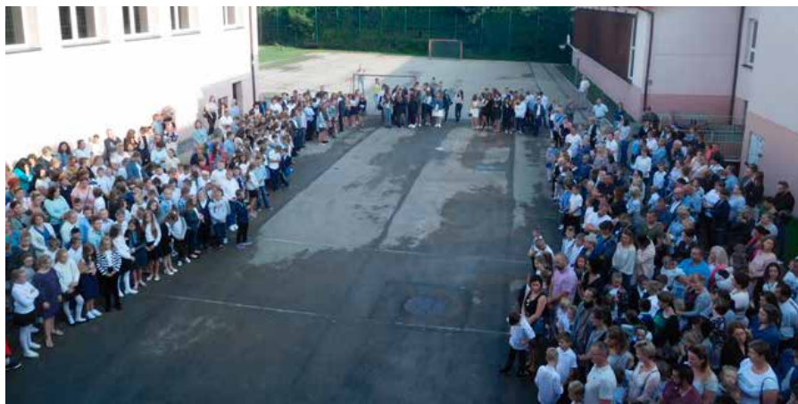
fol. SP Goleiszów

Wiara, pragnienia, postanowienia i wytrwałość w dążeniu do celu niechaj towarzyszą wszystkim przez cały rok. U progu nowego roku szkolnego życzę wszystkim odwagi w pokonywaniu trudności, łatwości w zadawaniu pytań w razie wątpliwości a także tego, byście umieli prosić o pomoc, gdy zajdzie taka potrzeba.