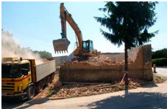
Rozbórka budynku w Golezowie

Gmina wsparła również Policję oraz Państwową Straż Pożarną. Cieszyńskiej jednostce przekazano rzutnik multimedialny oraz komplet opon do samochodu pożarniczego. (dok. 4 str.)