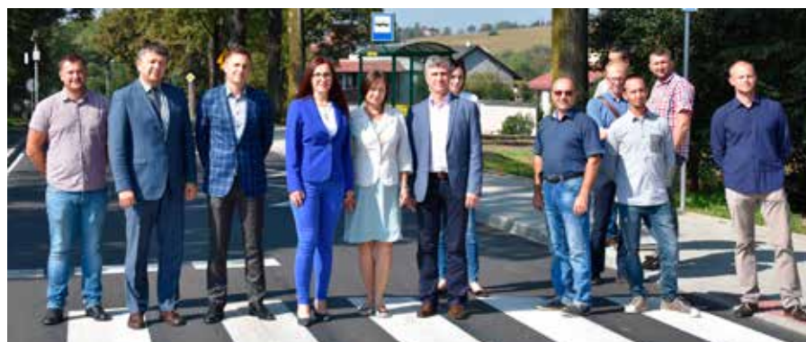
Uczestnicy odbioru wykonanych prac