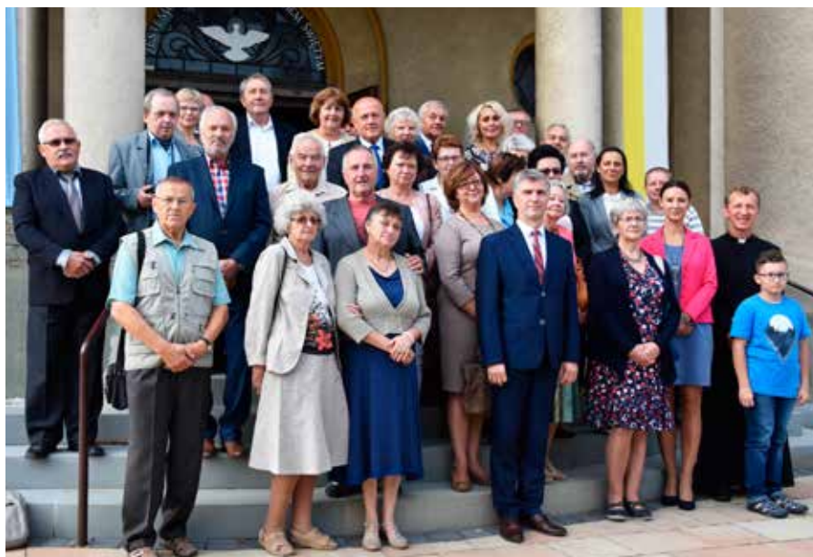
Uczestnicy mszy świętej