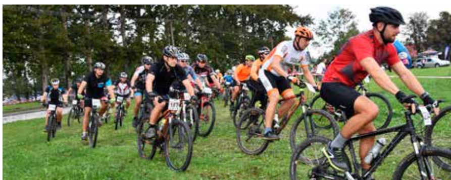
Start na dystansie 18 i 36 km