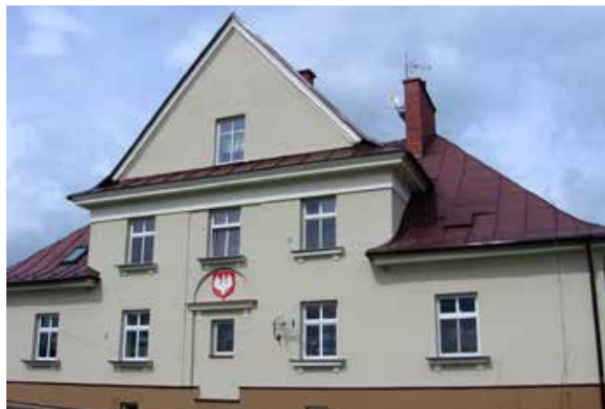
Odnowiony budynek w Puńcowie