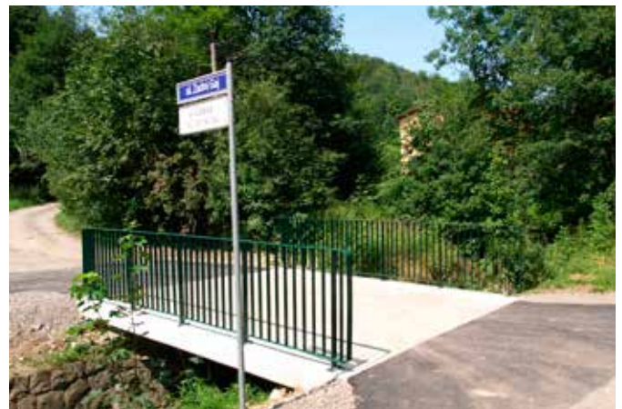
Most w Cisownicy