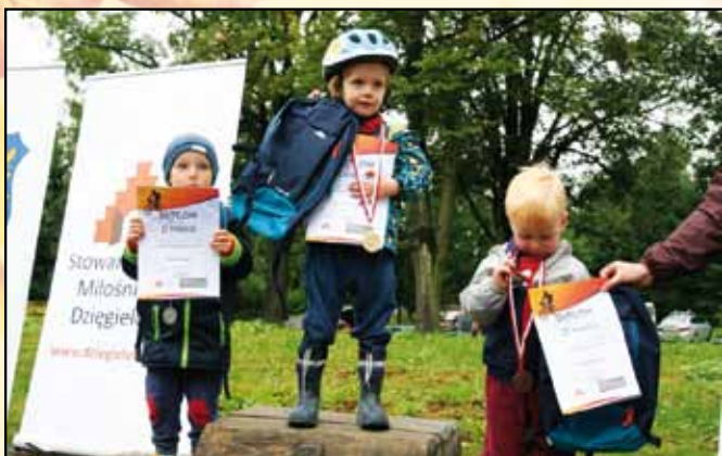
To może ich pierwsze podium w karierze