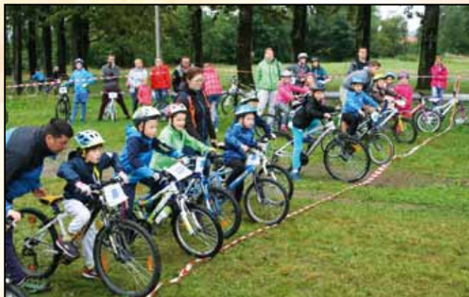
Tutaj startują ci trochę starsi