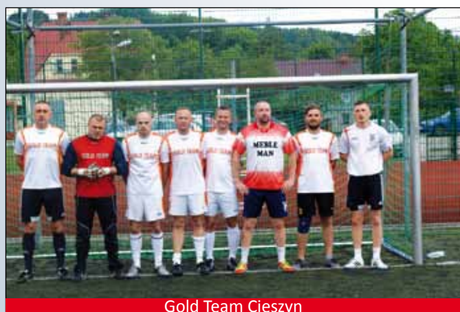
Gold Team Cieszyn