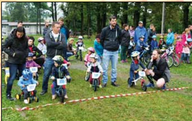
Start najmłodszych kolarzy