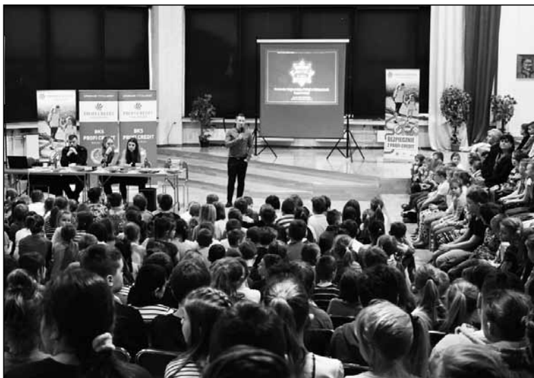
Spotkanie w jednej ze szkół w Bielsku Białej

obowiązkowo nosić. Najmłodszy otrzymają również ulotki przygotowane przez WORD, z których dowiedzą się o właściwych zachowaniach na drodze. Nie zabraknie również zaproszeń na mecze siatkarskiej drużyny BKS PROFİ CREDIT, a także wspólnych zajęć sportowych, które poprowadzą zawodniczki bielskiego klubu sportowego.