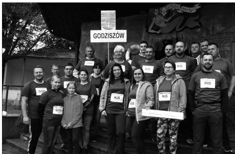
Ekipy Kisielowa i Godziszowa