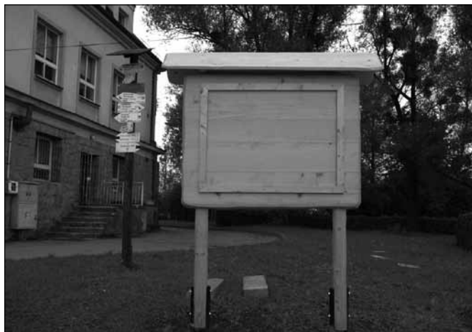
Tablica przed umieszczeniem na niej planszy z informacjami

W drugiej połowie października zakończą się prace nad nową ścieżką przyrodniczą, która połączy gminy Goleszów i Wędrynia ok. 15-kilometrowym szlakiem. Powstanie ona w ramach realizacji projektu pn. „Przyroda nie zna granic”. Nowo powstały szlak przebiegać będzie przez Goleszów, Dziegiełłów, Leszną Górną oraz Wędrynię.