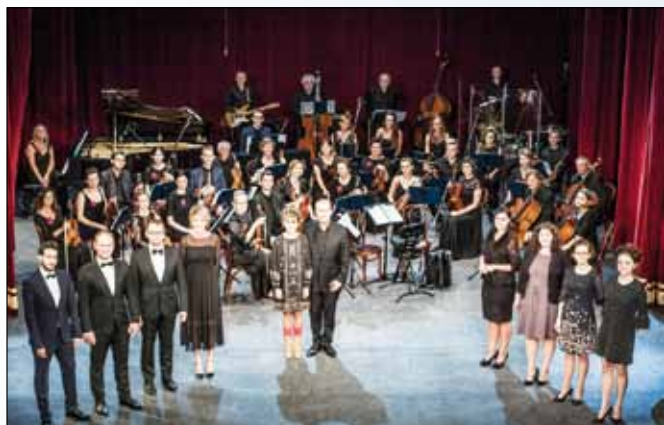
Orkiestra w pełnej krasie