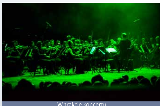
W trakcie koncertu