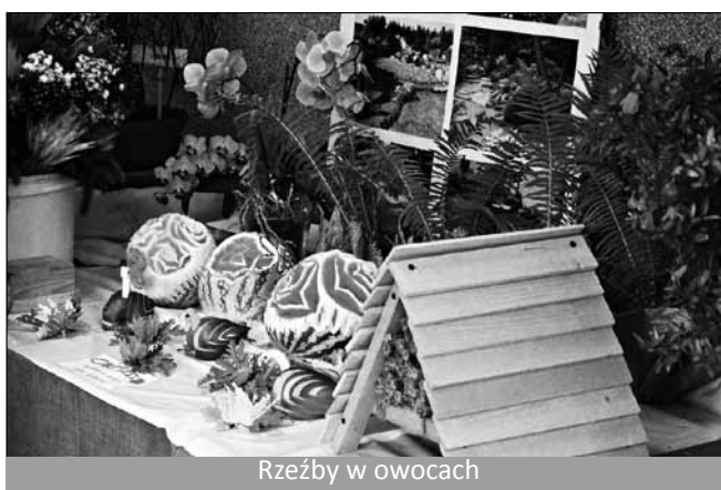
Rzeźby w owocach

przez wodospady wpadającym do jeziora otoczonego gęstwiną roślin wodnych. Leśna polana porośnięta trawą oraz drzewami stworzonymi z artystycznie uformowanymi bonzai, a pod nimi mnóstwo kwiatów - to prawdziwy żywy obraz krajobrazów naszej gminy, który uzupełniały tablice finalistów Konkursu „Gmina Golezów w kwiatkach i zieleni”. Wśród unikatowych okazów kwiatów naszych ogrodników można było znaleźć również stanowisko, gdzie pokazano dobro jakie dla naszych ogrodów czynią nasi mali sprzymierzeńcy. Przy eksponowanych owocach i warzywach pokazano też produkty i preparaty, które stosowane w ogrodzie znacząco ograniczają szkodliwość chorób i szkodników roślin a również pozwalają na wykorzystanie znajdujących się w glebie zablokowanych związków odżywczych dla roślin. Cieszyło się ono z zainteresowaniem zwiedzających. Również znacznym zainteresowaniem cieszyło się miejsce gdzie autor tego tekstu wyeksponował piękno sztuki „Carving” – rzeźby w owocach, oraz piękno natury pokazanej na jego obrazach. Ogólnie wystawa cieszyła się powodzeniem oraz uznaniem zwiedzających, o czym świadczą wpisy do książki pamiątkowej. Serdeczne podziękowania dla wszystkich osób, które przyczyniły się do tego, że można było oglądać piękno i dobro natury.