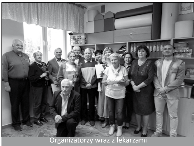
Organizatorzy wraz z lekarzami

W wydarzeniu wzięło udział ponad 30 chętnych - pacjen-