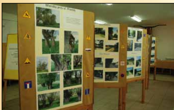
Wystawa zorganizowana w ramach Sportowej soboty