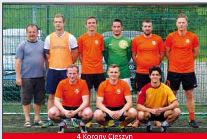
4 Korony Cieszyn