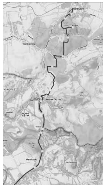
Przebieg ścieżki oraz miejsca umieszczenia tablic