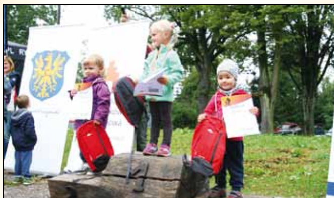
Jedni są nagradzani, inni kontemplują piękno herbu Powiatu Cieszyńskiego