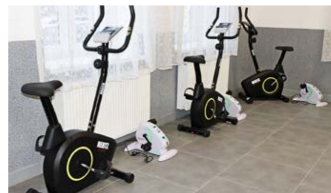
Wyposażenie Klubu Seniora w Cisownicy

W marcu w Zespole Szkolno-Przedszkolnym w Dziegiełowie odbyła się 8. edycja Gminnego Konkursu Czytelniczego pn. „Czytanie nie jest takie złe...”. Bohaterkami wydarzenia były dwie książki: Pozłacana rybka Barbary Kosmowskiej i Niesamowite przypadki Cymona Maksymalnego Edmunda Niziurskiego. Kolejna, a więc 9. edycja konkursu miała miejsce w listopadzie