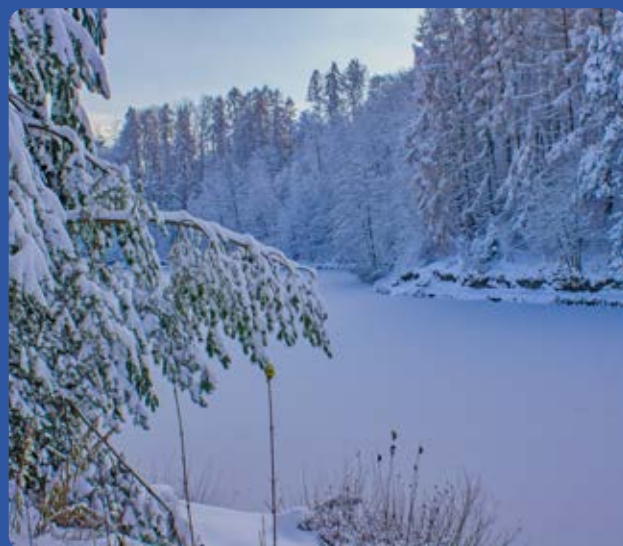
Zbiornik wodny Ton w Golezowie