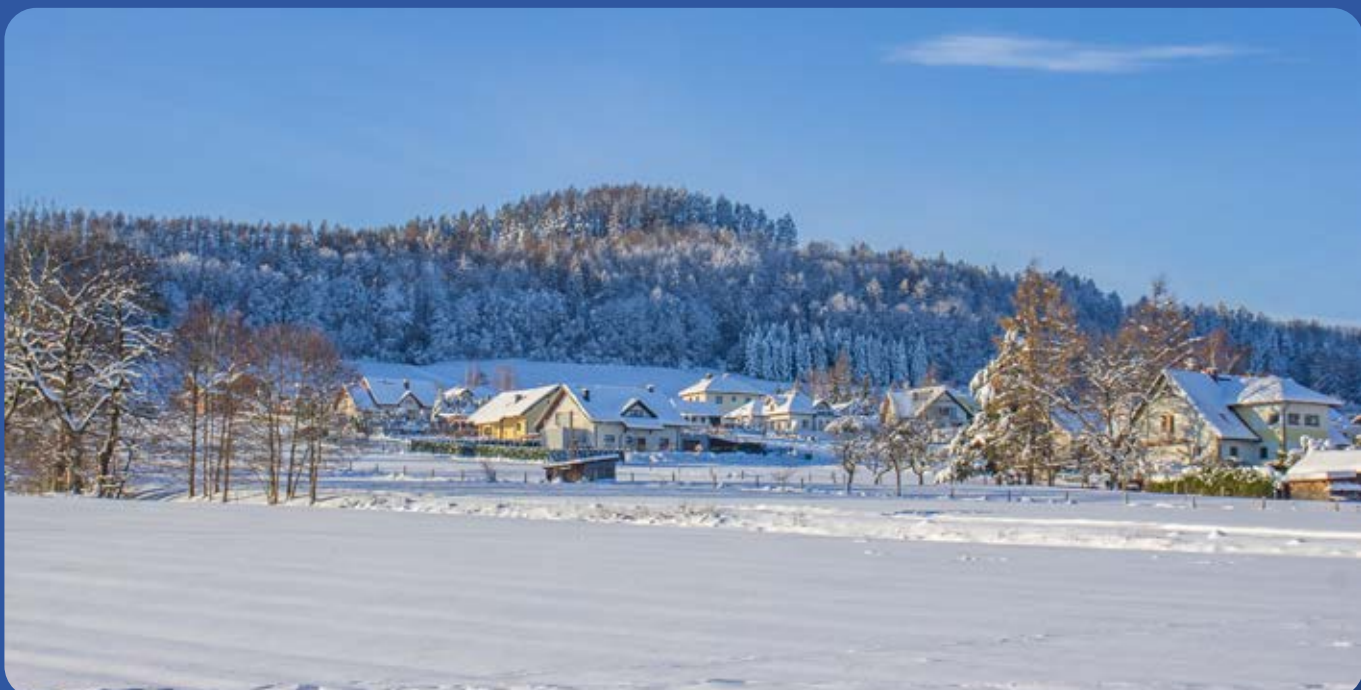
Golezów, u podnóża Wyrchóry