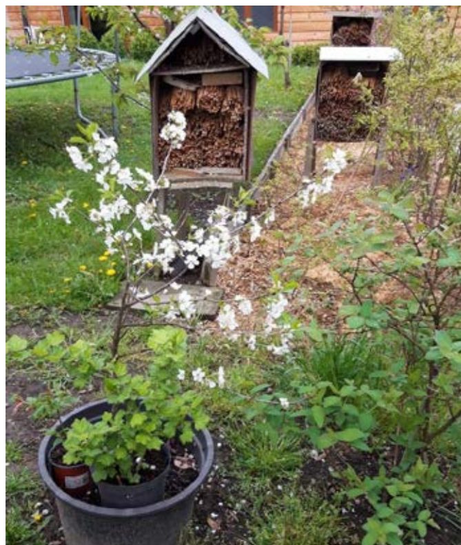
Domki murarek w ogrodzie