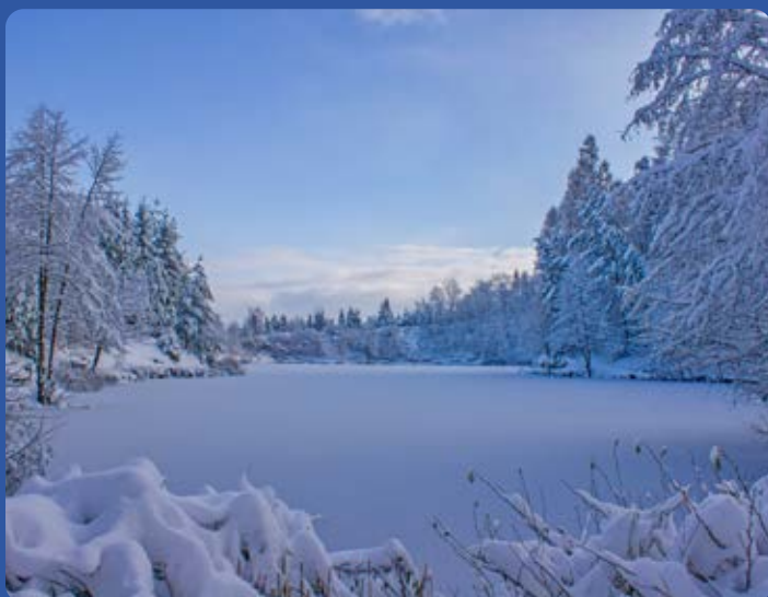
Zbiornik wodny Ton w Golezowie