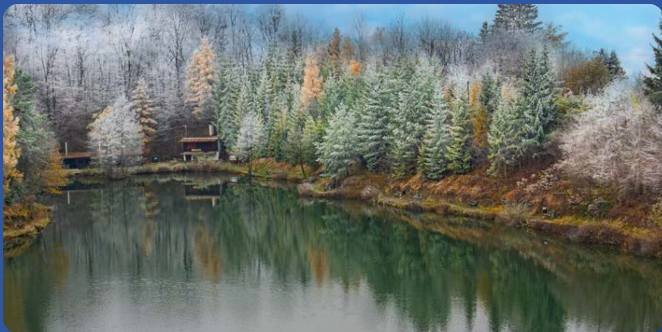
Zbiornik wodny Ton w Golezowie