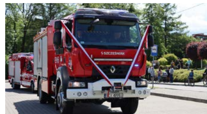
Przekazanie wozu bojowego dla OSP Goleszów

W celu podniesienia jakości usług społecznych oraz dopasowania ich do potrzeb wszystkich mieszkańców powstało w naszej gminie pierwsze w powiecie cieszyńskim Centrum Usług Społecznych. Zrealizowanie tego zadania było możliwe dzięki pozyskaniu dofinansowania w ramach Regionalnego Programu Operacyjnego Województwa Śląskiego na lata 2014–2020. Prace obejmowały przeprowadzenie remontu oraz modernizację lokalu w budynku przy ulicy Cieszyńskiej 29 w Goleszowie, w którym dotychczas funkcjonował Gminny Ośrodek Pomocy Społecznej, przekształcony w Centrum Usług Społecznych. Rozbudowie usług społecznych skierowanych do wszystkich mieszkańców gminy Goleszów dedykowanych było także kilka projektów, w tym „DAR-CZYŃCA. Czyńmy dobro razem”, w ramach którego została stworzona specjalna aplikacja ułatwiająca proces