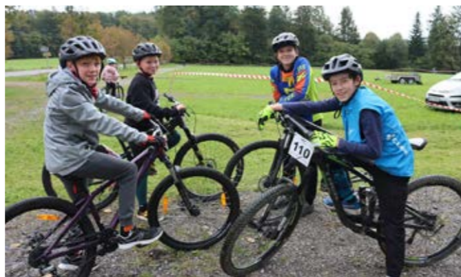
Cross Bike w Dzięgielowie

W maju mieszkańcy naszej gminy cieszyli się z awansu drużyny LKS Tempo Puńców do półfinału Pucharu Polski Śląskiego Związku Piłki Nożnej. Potwierdzeniem