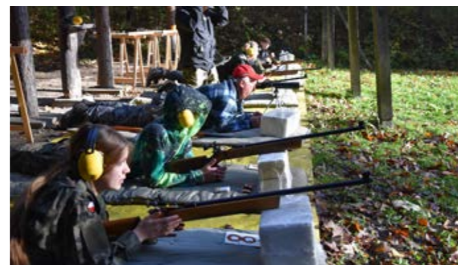
Zawody strzeleckie w Goleszowie

w międzynarodowych zawodach w skokach narciarskich w Szczyrku oraz odniosła dwa zwycięstwa w konkursach FIS Cup na skoczni w szwajcarskim Einsiedeln.