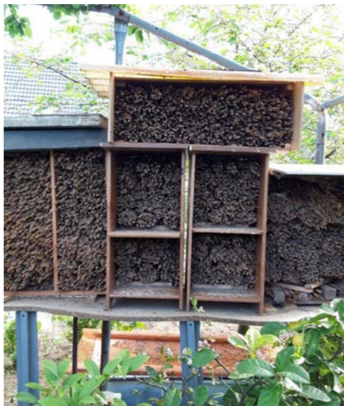
Kolonija murarki ogrodowej