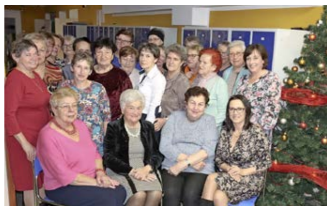
Wigilijka KGW Dzięgielów

W obu spotkaniach wzięło udział prawie 100 osób, a od początku działalności członkami obu organizacji pozarządowych stają się następne pokolenia mieszkańców naszej gminy. Warto przypomnieć, że dzięgielowskie KGW obchodziło w minionym roku 90-lecie swojego istnienia, „Ślimoki” zaś w 2024 roku będą świętować 20. urodziny.