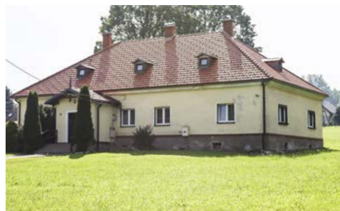
Dach plebanii w Puńcowie po remoncie

Korzystając z 50-procentowego wkładu własnego, beneficjenci mieli możliwość wykonania prac konserwatorskich, restauratorskich lub robót budowlanych przy obiektach wpisanych do rejestru zabytków bądź znajdujących się w gminnej ewidencji zabytków, położonych na terenie gminy Goleiszów.