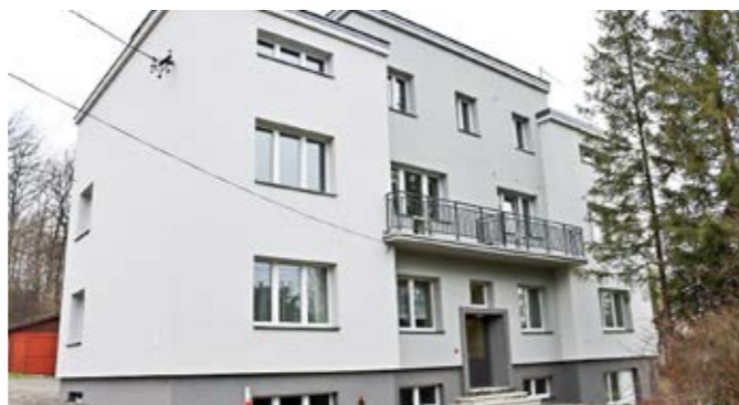
Dom nauczyciela w Cisownicy po remoncie

Do zakończonych zadań inwestycyjnych można dopisać także prace związane z termomodernizacją Domu nauczyciela w Goleszowie i Cisownicy. To kolejna inwe-