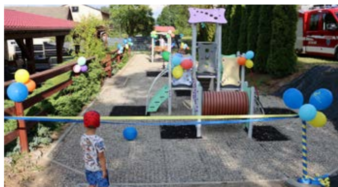
Otwarcie placu zabaw w Godziszowie

W ostatnich dwunastu miesiącach przeprowadzono kompleksowy remont blisko 5 km dróg. Ciężki sprzęt można było spotkać m.in. na ulicach: Spacerowej w Lesznej Górnej, Krokusów w Cisownicy, Słonecznej w Kozakowicach Dolnych, Stromej, Orzechowej, Skrajnej i Radoniowej w Goleszowie, Rolniczej i Granicznej w Puńcowie, Skotniej w Bażanowicach oraz Spacerowej i ks. Kulisza w Dziegiełowie. Dzięki bliskiej współpracy i partycypacji w kosztach również Powiatowy Zarząd Dróg Publicznych w Cieszynie dokonał remontu swoich dróg na terenie gminy Goleszów. W tym przypadku znaczną poprawą stanu nawierzchni dróg widoczna jest na kilometrowym odcinku ulicy Cieszyńskiej pomiędzy Dziegiełowem a Puńcowem oraz na półtorakilometrowym odcinku ulicy Wolności w Goleszowie, w ciągu drogi powiatowej Goleszów – Międzyzwieć. Gmina pozyskała także środki na stabilizację osuwiska przy ulicy Lipowej w Lesznej Górnej.