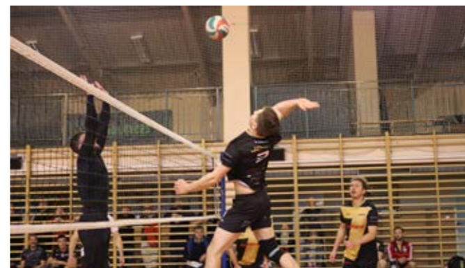
Turniej piłki siatkowej o puchar wójta