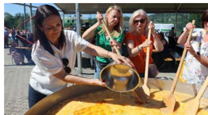
Piknik rodzinny w Goleiszowie

Z wakacjami nierozłącznie związany jest także Tydzień Ewangelizacyjny w Dzięgielowie – wydarzenie ewangelizacyjne corocznie organizowane w tej miejscowości. Po dwuletniej przerwie spowodowanej pandemią 73. Tydzień Ewangelizacyjny odbył się pod hasłem „Spotkajmy się”. Na uczestników czekały m.in. koncerty, seminaria i oczywiście spotkania ewangelizacyjne dla dorosłych, młodzieży i dzieci. Również w Dzięgielowie, ale tym razem na terenie dzięgielowskiego zamku, odbyło się Święto Sąsiada. Na dziedzińcu i we wnętrzach zabytkowego obiektu zgromadziło się około 150 uczestników, którzy wysłuchali dwóch koncertów pianistycznych oraz występu skrzypka. Wydarzenie zostało poprzedzone polsko-ukraińskimi warsztatami kulinarnymi.