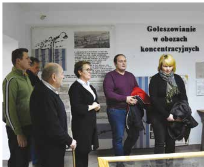
fol. K. Grzybek