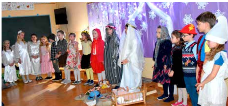
fol. I. Franek

Dzieci z klasy pierwszej i drugiej wcieliły się w postacie bajkowe, które przyniosły dary małemu Jezusowi. Klasa trzecia, przebrana za diabły, zaprezentowała Boże Narodzenie widziane z perspektywy piekła. W trzeciej odsłonie ożyły postacie z tradycyjnej, bożonarodzeniowej szopki. Występ uświetniły kolędy i taniec „Kotysanka dla Jezuska”. W przerwie między odsłonami uczestnicy jasełek mieli okazję poczęstować się wypiekami przygotowanymi przez rodziców.