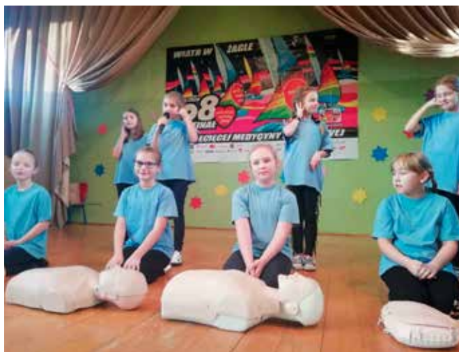
fol. SP Goleszów