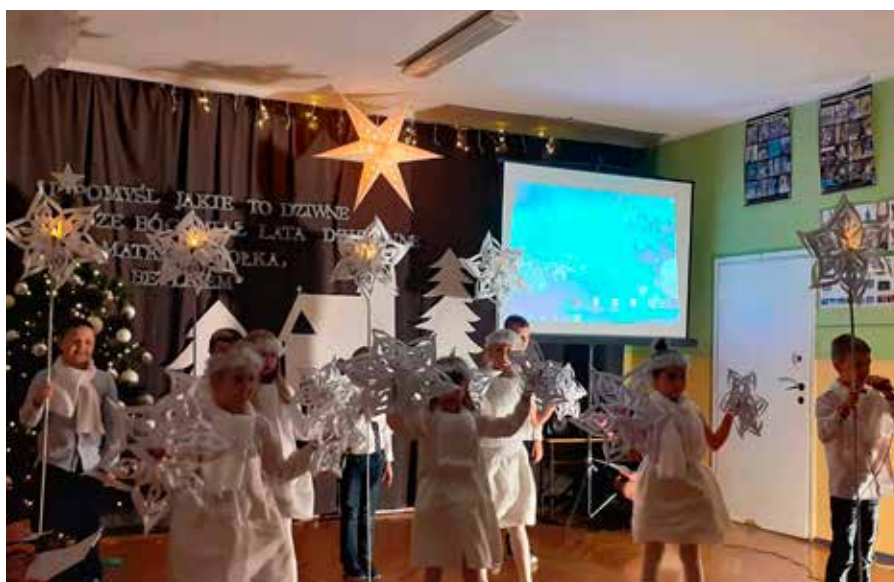
fol. SP Bażanowice

W tym roku, w ramach tradycyjnego, rodzinnego kolędowania, każda klasa przygotowała krótki program spięty w całość przez szkolny chór oraz wspólne wykonanie kolęd.