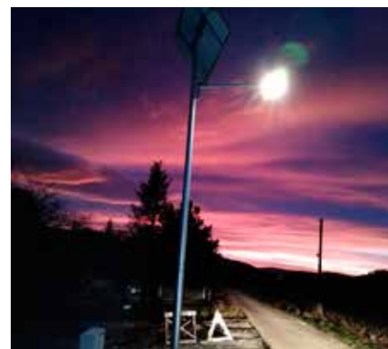
Goleiszów Równia, ul. Brzozowa, lampa solarna