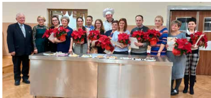
fol. M. Sikora-Poloczek

Kilka dni po ogłoszeniu wyników cieszyńskiego konkursu nastąpiło bo-