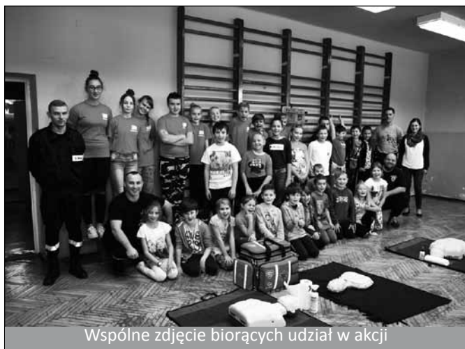
Wspólne zdjęcie biorących udział w akcji