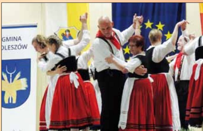
Występ grupy tanecznej Burkhardsfelden