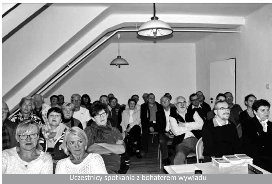
Uczestnicy spotkania z bohaterem wywiadu