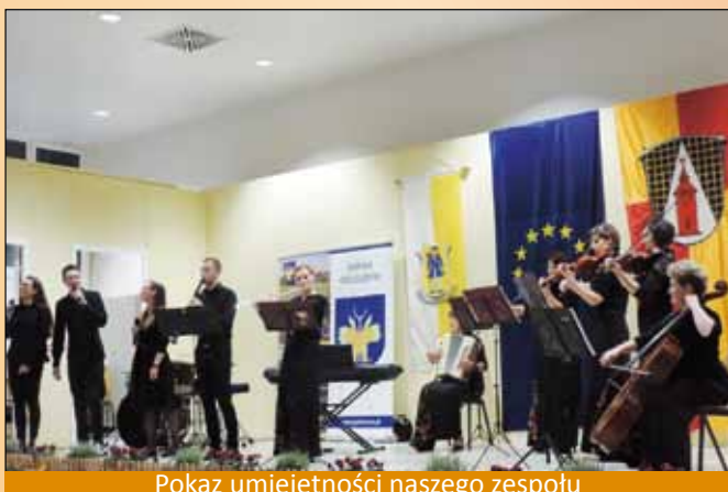
Pokaz umiejętności naszego zespołu