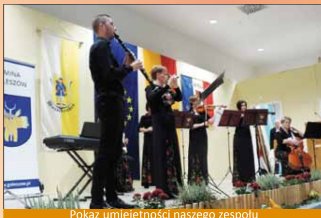
Pokaz umiejętności naszego zespołu