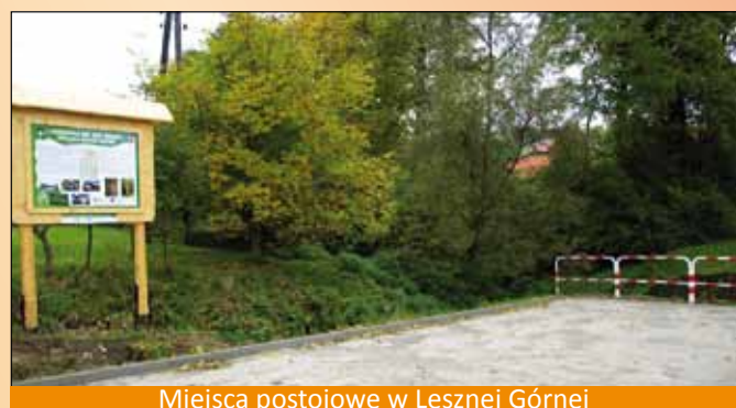
Miejsca postojowe w Lesznej Górnej