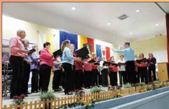
Niemiecki chór mieszany Concordia-Linderkrantz