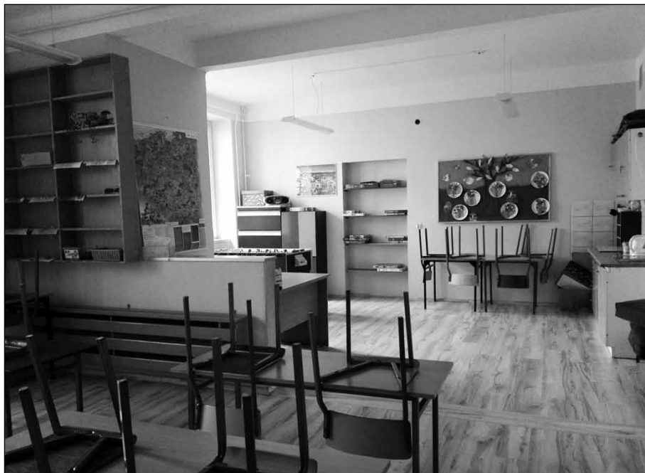
Jedno z wyremontowanych pomieszczeń