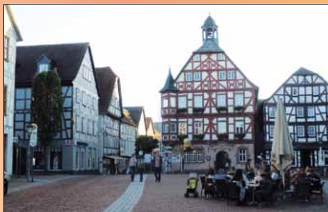
Urokliwy rynek w Reiskirchen