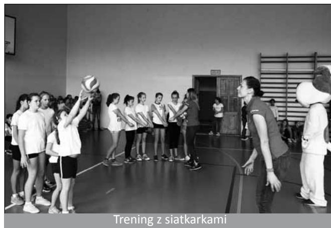
Trening z siatkarkami

Siatkarki odpowiadały na pytania zadawane przez dzieci np. Jak często trenują? Co jedzą? W jakim wieku rozpoczęły przygodę z siatkówką? Policjant i przedstawiciel WORDu przypomnieli dzieciom o zasadach bezpieczeństwa podczas imprez i przepisach ruchu drogowego, a Reksio pomagał w rozdawaniu odznak. Dzieci otrzymały również ulotki informacyjne oraz zaproszenia na mecz bielskiej drużyny