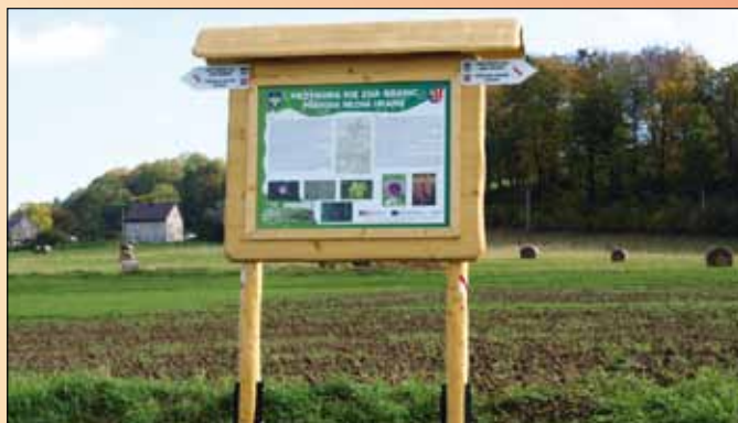
Tablica informacyjna pod Tułem