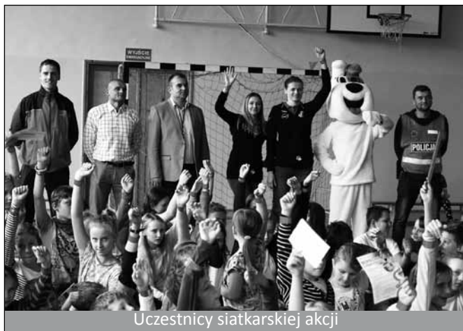
Uczestnicy siatkarskiej akcji

Szkoła Podstawowa w Cisownicy jako pierwsza zgłosiła chęć uczestnictwa w tegorocznej edycji akcji. Tym bardziej cieszymy się z udziału w tym wydarzeniu, bo już ruszyły w naszej szkole zajęcia piłki siatkowej dla dziewcząt, organizowane