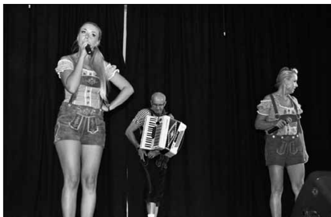
Koncert z okazji Dnia Mężczyzny