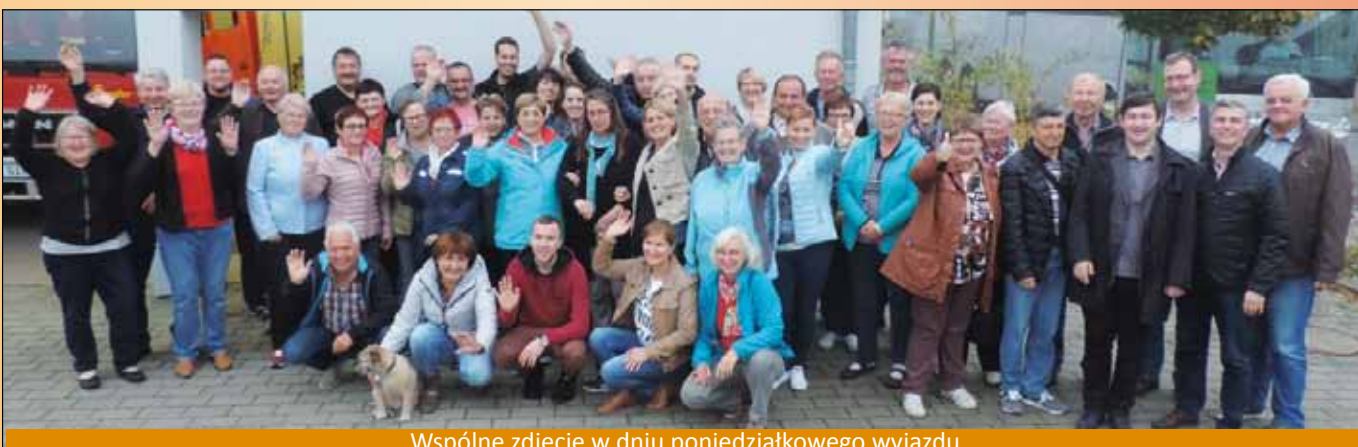
Wspólne zdjęcie w dniu poniedziałkowego wyjazdu