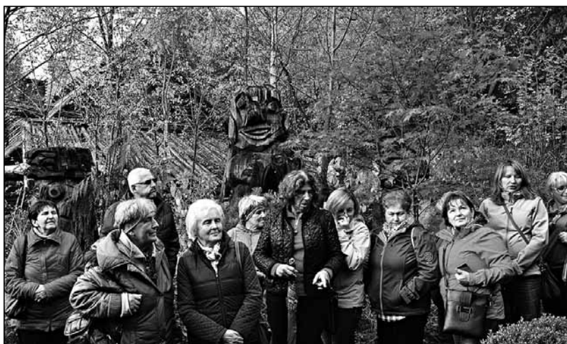
Zwiedzamy uroki Leśnego Grodu

swego czasu, pilotowanie naszego autokaru, przekazanie swojej ogromnej wiedzy naszej zwiedzającej grupie. Okazanym skrótem, przejeżdżamy przez nowo powstały tunel im. Emilii matki Jana Wojtyły w Lalikach o długości 678 m, który jest najdłuższym pozamiejskim tunelem w Polsce. W Milówce odwiedzamy „Starą Chałupę”, która jest przykładem tradycyjnego budownictwa ludowego Żywiecczyny początku pierwszej połowy XVIII w. Pracownica wydziału promocji Urzędu Gminy Milówka przyjechała specjalnie dla naszej grupy, aby osobiście oprowadzić nas po zakątkach tego obiektu. Jedziemy do Fortu „Wędrowiec”, obiektu pierwszej obrony przed najazdem wojsk hitlerowskich 1 września 1939r. Miejsce to zwane jest również „Westerplatte Południa”. Niestety, miejsce to oglądamy tylko po zewnętrznej stronie. Pomimo wielokrotnego potwierdzenia zamówienia przewodnika i zapewnieniu mnie, że będziemy oczekiwani o godz. 13:00, doszło do nieprzekazania społecznemu pracownikowi z Muzeum Żywieckiego o naszej grupie. Okazuje się, że po sezonie turystycznym obiekt na żądanie otwiera pracownik muzeum.