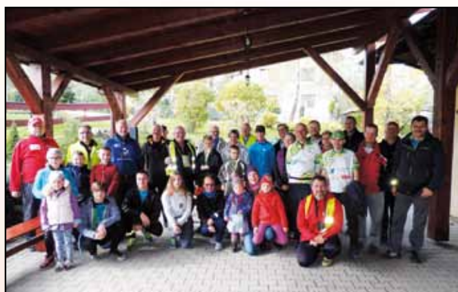
Wspólne zdjęcie uczestników Rajdu