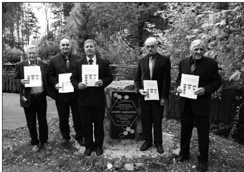
Przedstawiciele kół pszczelarskich z trzech krajów