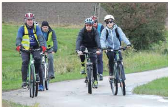
Na trasie rajdu