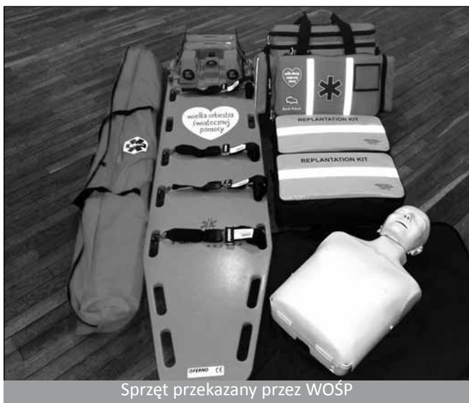
Sprzęt przekazany przez WOŚP

WOŚP i Związek Ochotniczych Straży Pożarnych podpisały w trakcie tej uroczystości oficjalne porozumienie, na mocy którego obie organizacje będą współdziałały przede wszystkim przy nauce i popularyzacji wiedzy o pierwszej pomocy wśród dzieci i młodzieży. Wspólne działania będą także dotyczyły takich przedsięwzięć jak udział w akcji bicia „ogólnopolskiego