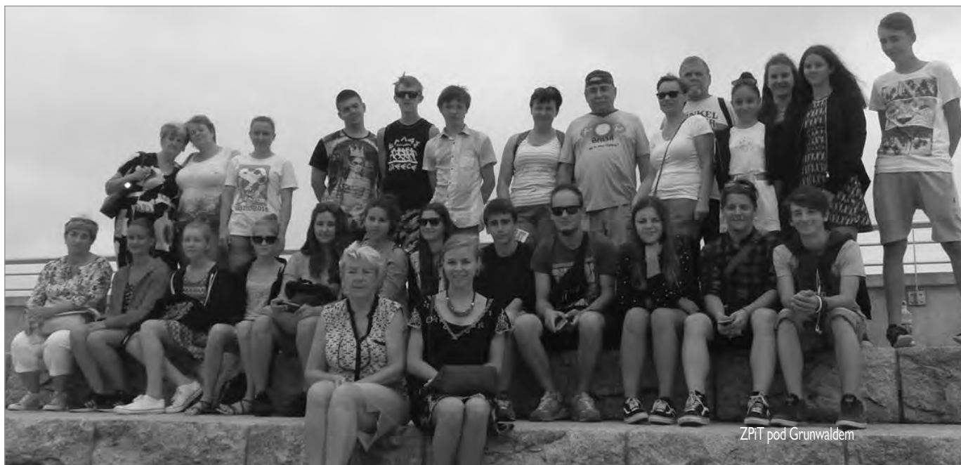
ZPiT pod Grunwaldem

15 lipca 1410 r. połączone wojska polsko-litewsko-rusko-tatarskie (około 29 tys. zbrojnych) pod dowództwem króla polskiego Władysława Jagiełły – nazywane także wojskami sprzymierzonymi – odniosły zwycięstwo nad wojskami krzyżackimi (około 21 tys.