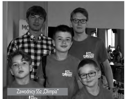
Zawodnicy SSz „Olimpia”