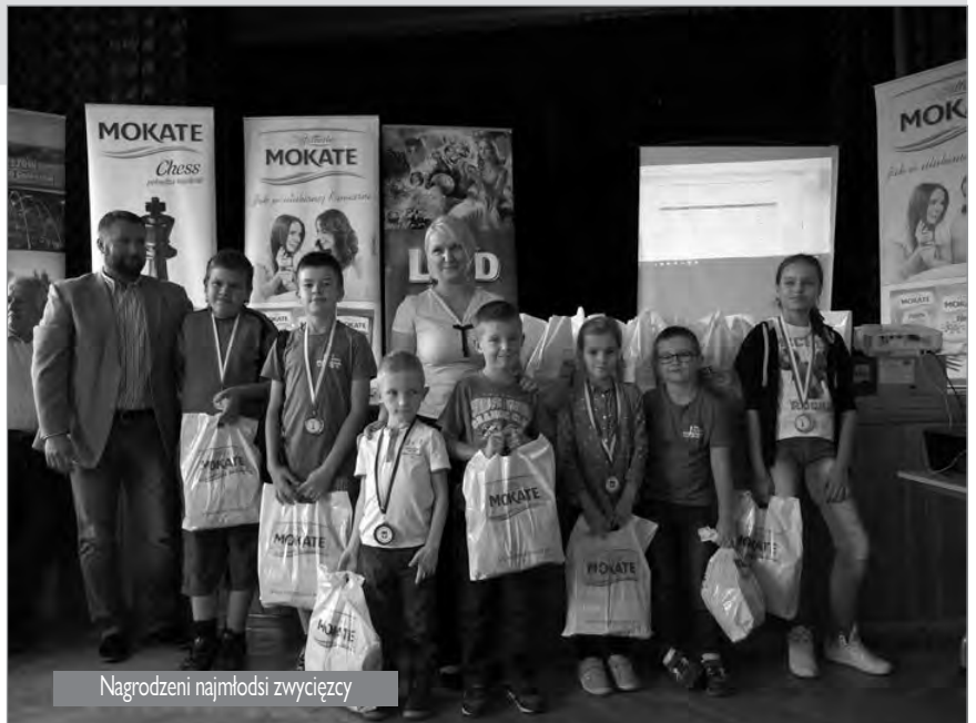
Nagrodzeni najmłodszy zwycięzcy

Tekst Karol Linert, foto Tomasz Lenkiewicz