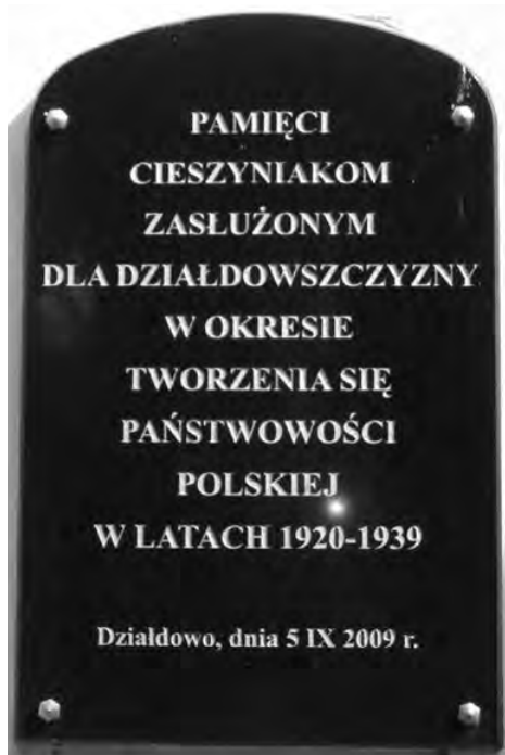
Tablica „Pamięci cieszyńiakom”

Polska władza napotykała wiele przeciwności. Już w sierpniu 1920 r. oddziały sowieckie próbowały zająć tereny Działdowszczyzny. Doznając klęski, wojska Armii Czerwonej plądrowały miejskie składy z alkoholem i odzieżą oraz zakład zegarmniczy.