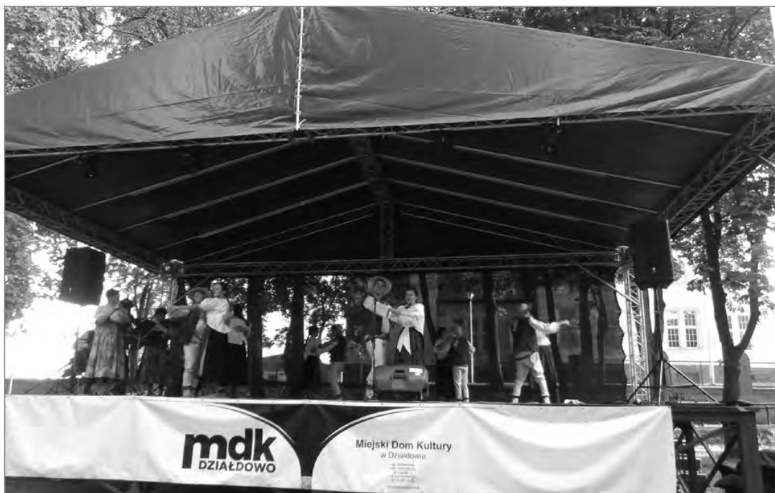
Występy w Działdowie

główna. Charakter muzeum i jego nowoczesność daje możliwość poruszania się w dowolny sposób po prezentowanych treściach w zależności od zainteresowań i potrzeb. Sala nr 1 prezentuje powstanie i ekspansję państwa krzyżackiego, sala nr 2 - codzienność w czasach zakonu krzyżackiego, sala nr 3 - technikę wojskową zakonu, sala nr 4 - bitwę pod Grunwaldem, sala nr 5 jest salą kinową.