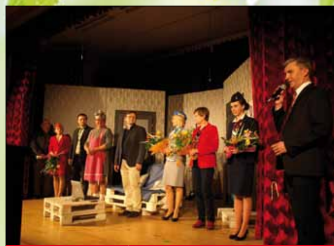
Wójt dziękuje aktorom