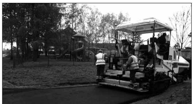
Podczas prac związanych z układaniem warstwy wiążącej - ul. Spokojna