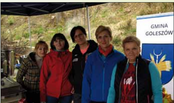
Obsługa stoiska Olimpij Goleiszów