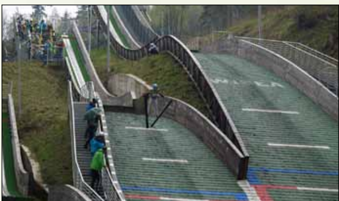
Skok na średniej skoczni