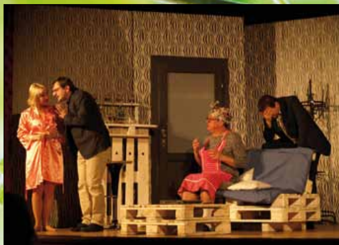
W trakcie spektaklu