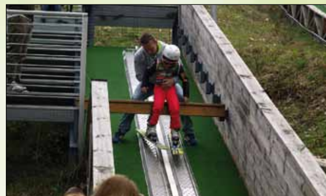
Asysta dla młodego skoczka