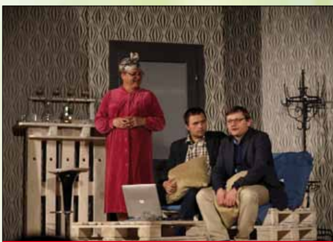
W trakcie spektaklu