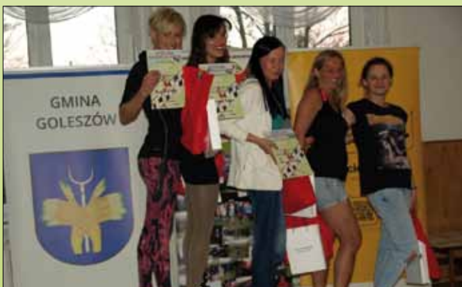
Najlepsze zawodniczki na dystansie 25 km