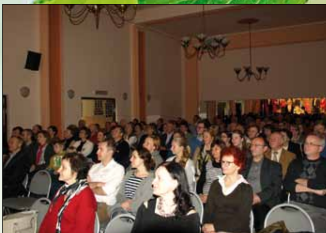
Publiczność wypełniła salę niemal do ostatniego miejsca