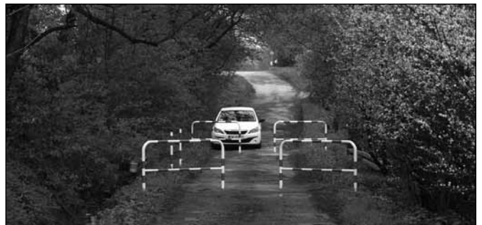
Barierki na ul. Spokojnej uniemożliwiający ruch samochodów

W związku ze złym stanem technicznym zabytkowego przepustu pod ulicą Spokojną, odcinek drogi pomiędzy wjazdem na ul. Cieszyńską, a terenem OSP Bażanowice został zamknięty dla ruchu samochodowego. Przepraszamy za powstałe utrudnienia.