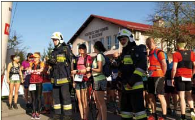
Na dystansie 25 km wystartowali reprezentanci OSP Goleiszów