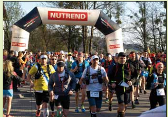
Start - kat. 50 km