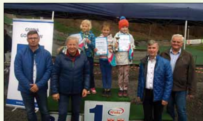
Ceremonia wręczenia nagród