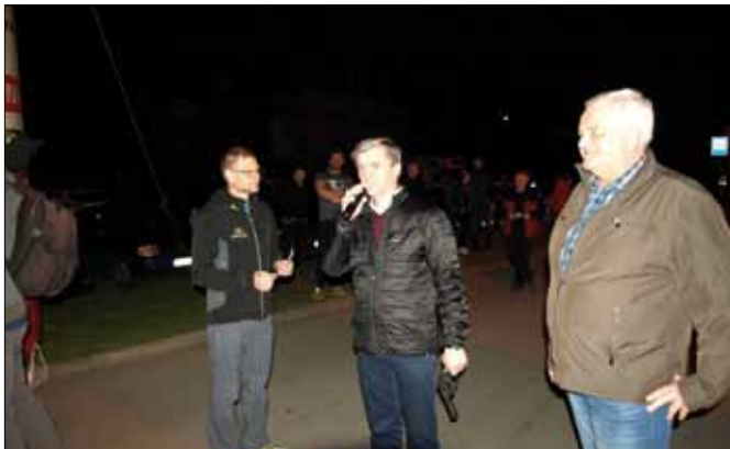
Wójt i Przewodniczący Rady Gminy witają zawodników na starcie morderczej, 100-kilometrowej trasy