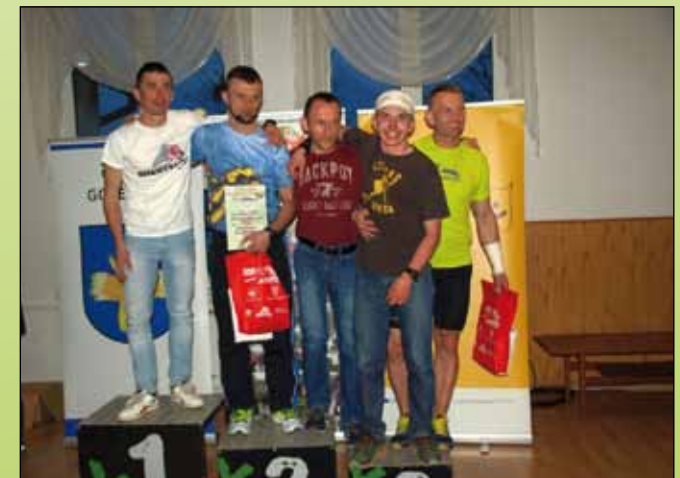
Najlepsza piątka zawodników na dystansie 100 km

Zachęcamy do obejrzenia fotoreportażu na www.goleszow.pl