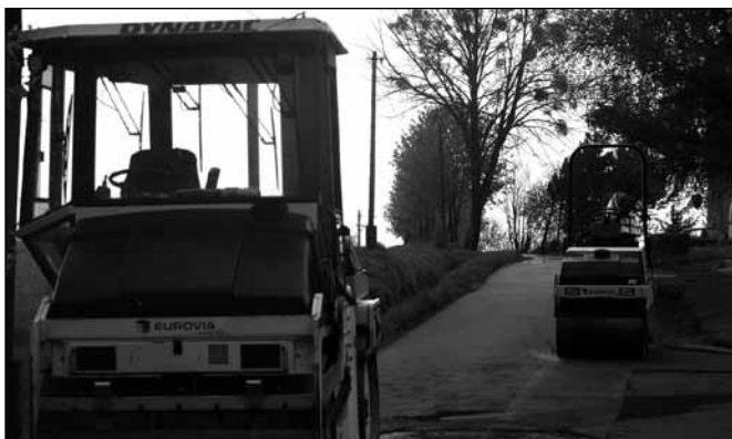
Podczas prac związanych z układaniem warstwy wiążącej - ul. Spokojna