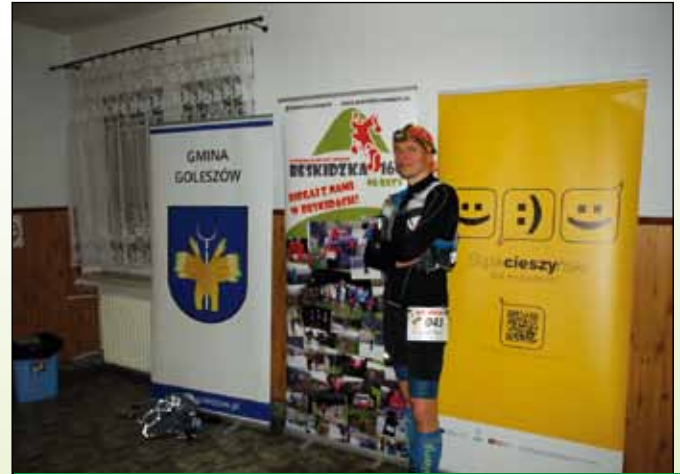
Jeden ze śmiałków