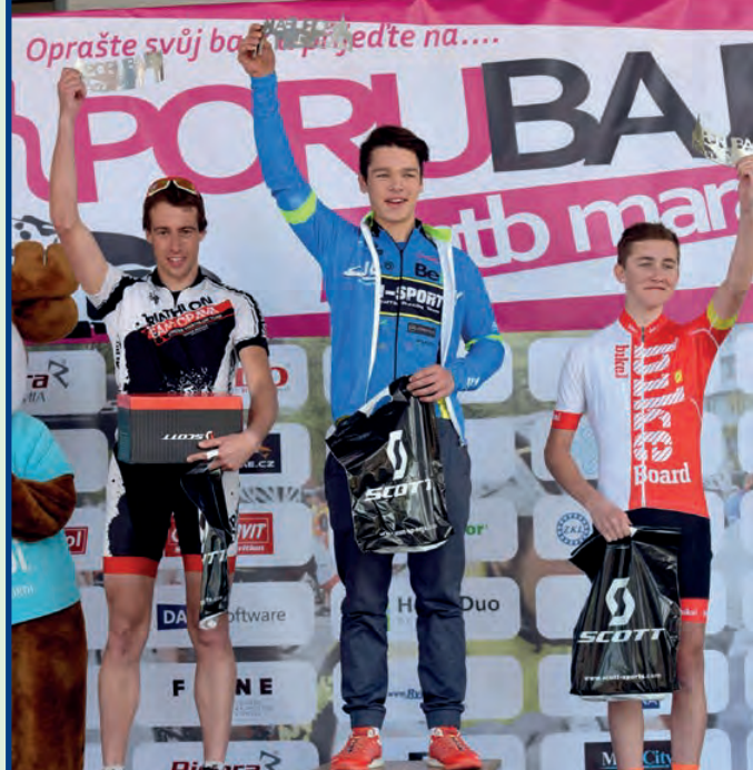
Jeden z pierwszych pucharów