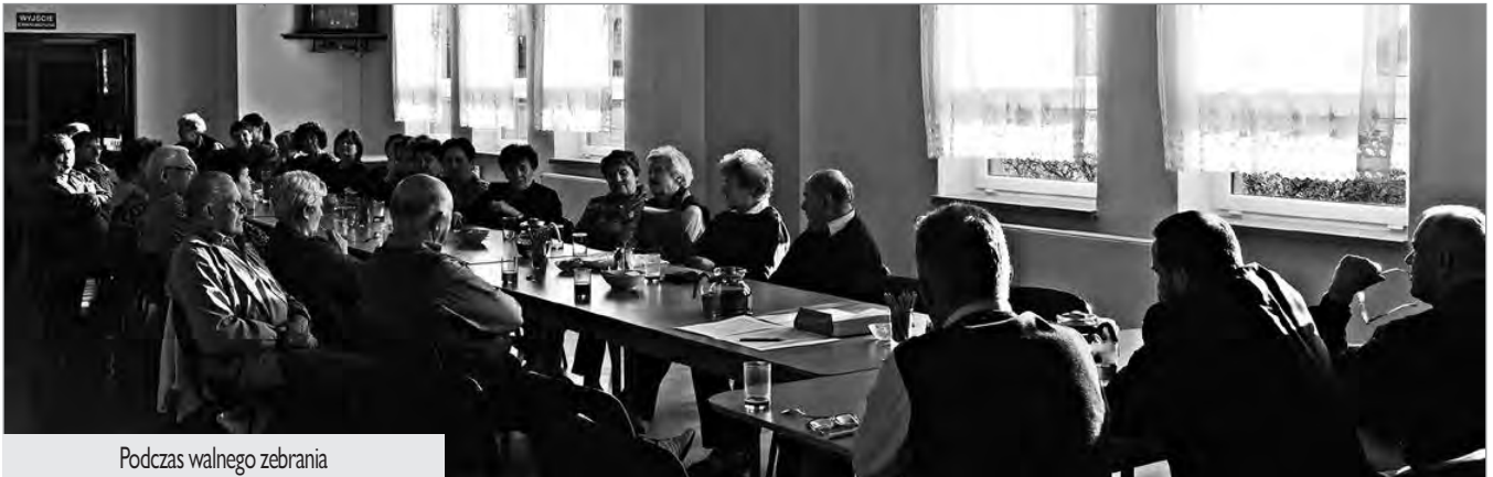
Podczas walnego zebrania