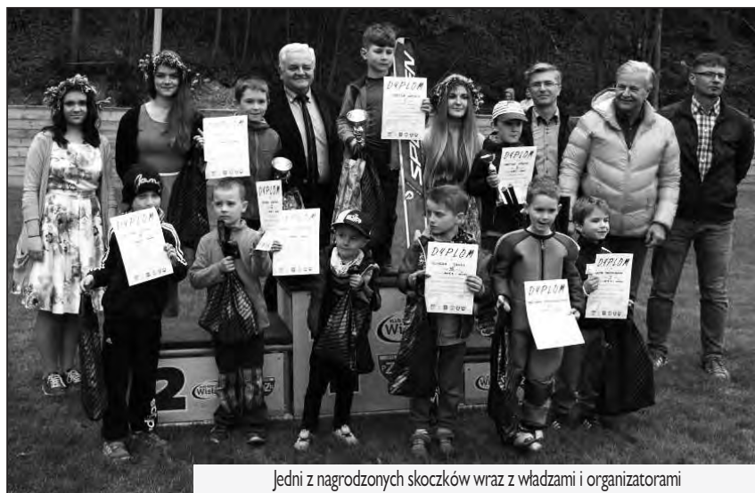
Jedni z nagrodzonych skoczków wraz z władzami i organizatorami

Obszerny fotoreportaż oraz szczegółowe wyniki na www.goleiszow.pl