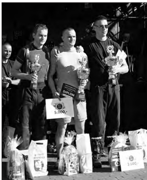
Z pucharami i wywalczonymi nagrodami

To drugie zawody tego typu, w których brali udział nasi strażacy. Doświadczenie z zeszłego roku bardzo się przydało.