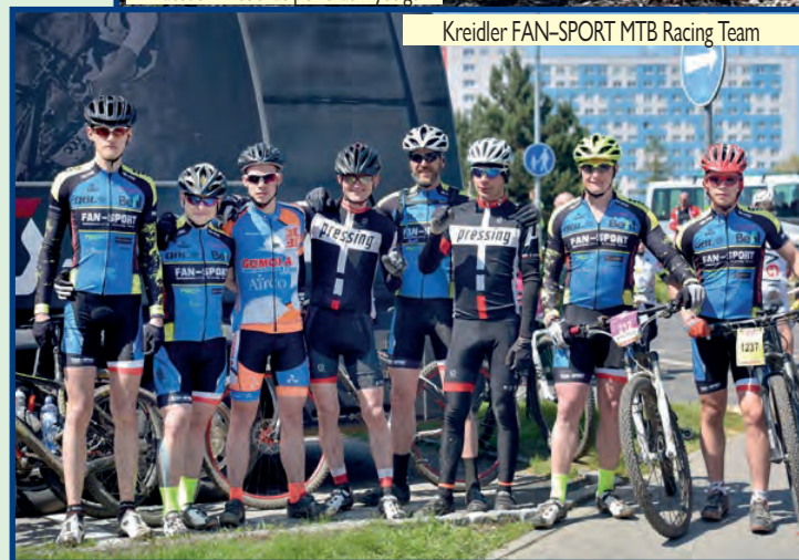
Kreidler FAN-SPORT MTB Racing Team