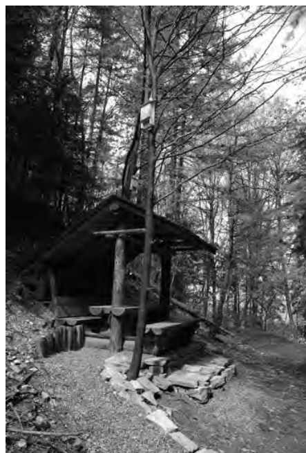
Wiaty w Ajszynie