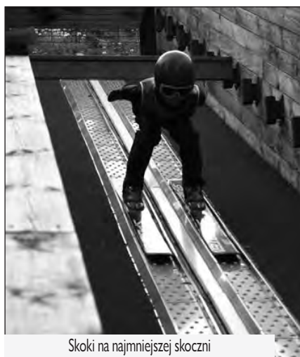
Skoki na najmniejszej skoczni

LKS „Olimpia” Goleiszów składa podziękowania sponsorom, którymi byli: Hurtownia „ART-CHEM” Ustroń, Hurtownia MEGA-SPORT Bielsko-Biała, Firma FAMEKS Goleiszów, Zakład Przetwórstwa Mięsnego „Jan Bielez” Gole-