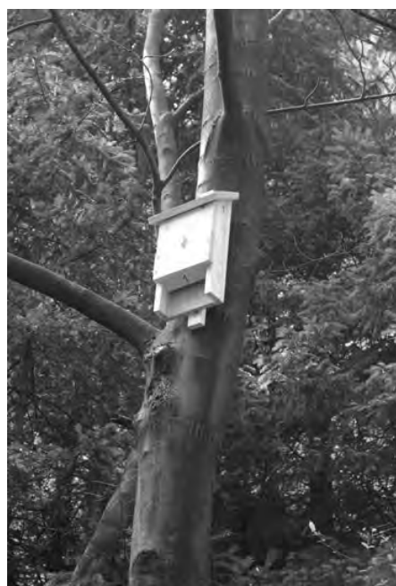
Budka dla nietoperzy

Reszta należała już do członków stowarzyszenia. W ramach wolontariatu udało się do tej pory oczyścić z pościnianych drzew, gałęzi i krzewów wielką polanę pod Wyrgóram i częściowo wąwóz Ajsznyt. Oczyściliśmy jeszcze jedno miejsce z młodych drzew przy ścieżce na Wyrgórze. Teren ten został wytypowany w zeszłym roku, kiedy poszukiwaliśmy motyla modraszka Rebela i rośliny żywicielskiej dla jego gąsienic – goryczki krzyżowej. Wycięcie drzew i krzewów ma na celu obfitsze występowanie i kwitnienie goryczki, a tym samym odbudowanie populacji bardzo rzadkiego i chronionego modraszka Rebela.