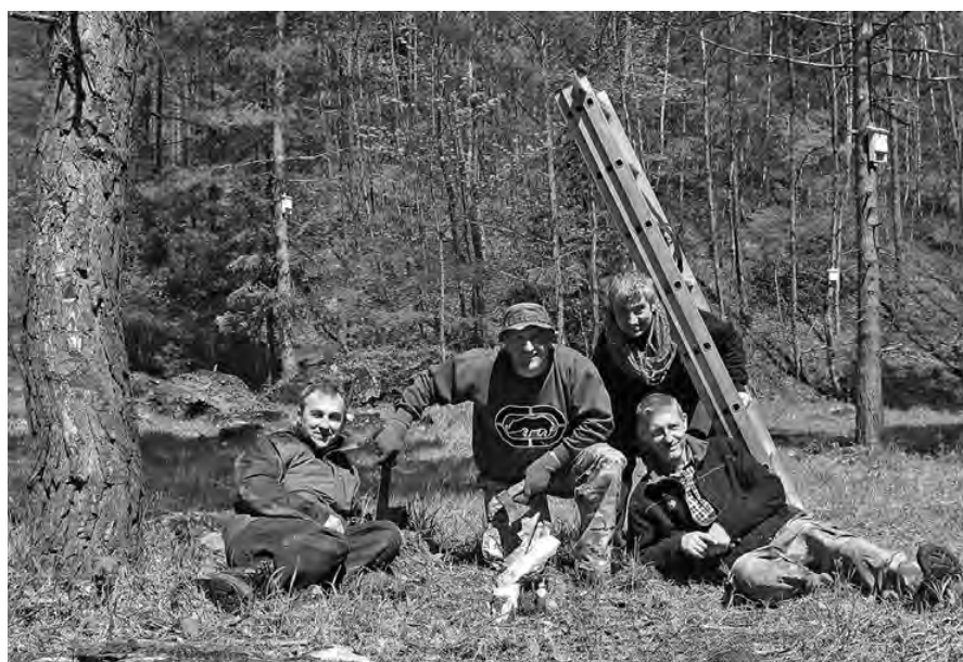
Część brygady Jasieniowa przy wieszaniu budek

Członkowie Stowarzyszenia Górecki Klub Przyrodniczy