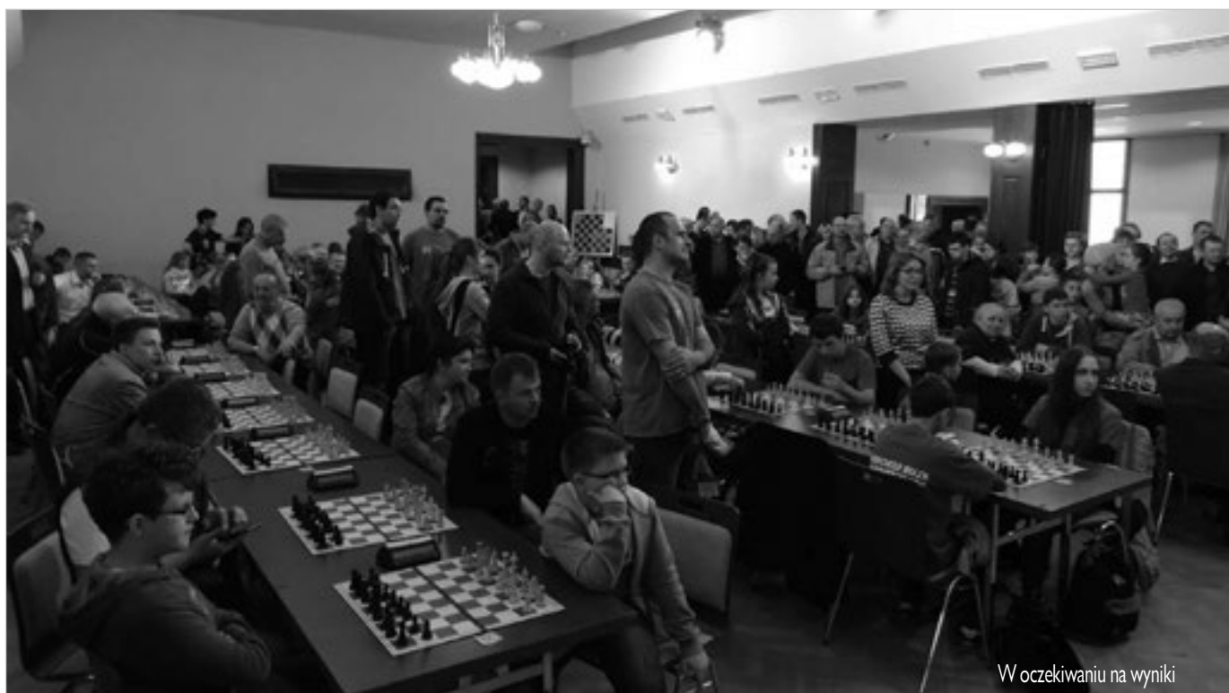
W oczekiwaniu na wyniki