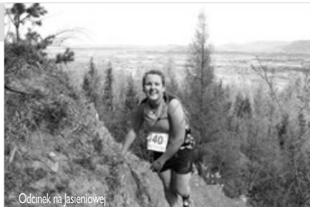
Odcinek na Jasieniowej

Organizatorem zawodów był MKS-R „Centrum” z Dziegielowa, współorganizatorem Gmina Goleiszów i Stowarzyszenie 4 Pory Życia. Partnerami w organizacji zawodów byli: Miasto Wisła, Miasto Ustroń, Powiat Cieszyński, firma Nutrend. Patronat medialny nad