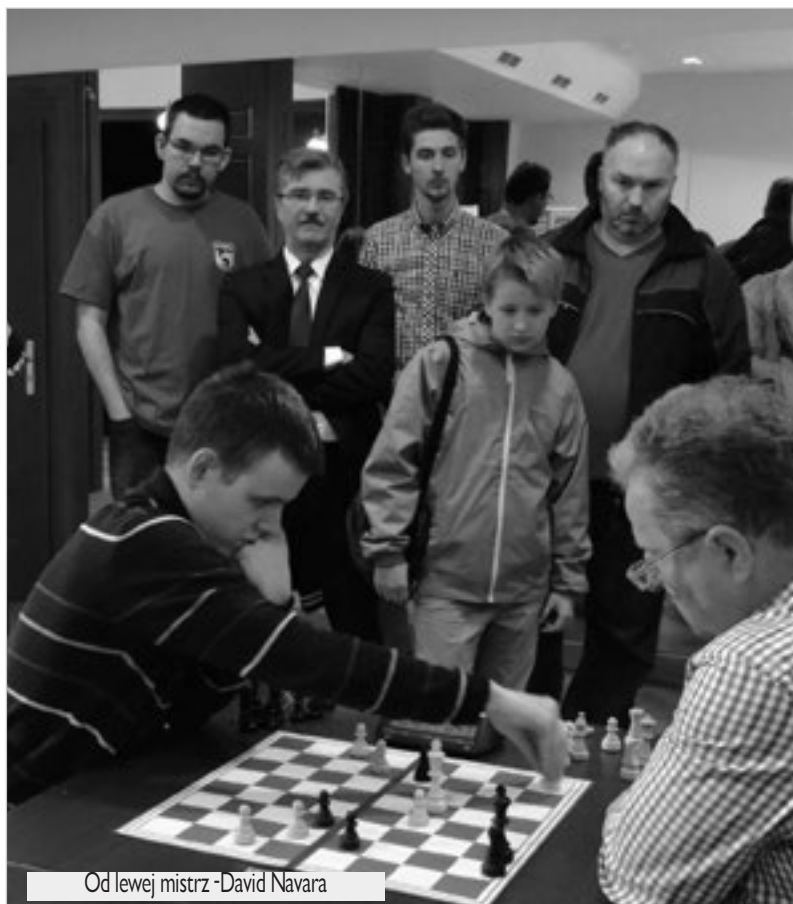
Od lewej mistrz - David Navara

tualne późniejsze reklamacje), rozpoczęliśmy drugą rundę, w tym czasie podmieniliśmy laptopy i tylko jedna z drukarek „zareagowała”, tyle że wydruk jednej strony w trybie „szybki roboczy”, nie wiedzieć dlaczego, trwał ze 3 minuty, ale zawsze jest to wydruk, dodam, niezbędny wydruk.