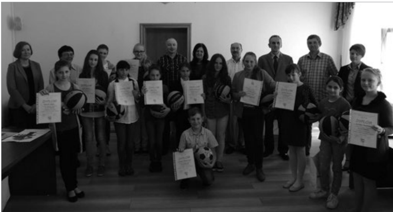
Nagrodzeni uczniowie wraz z opiekunami, przedstawicielami samorządu i członkami PTTK