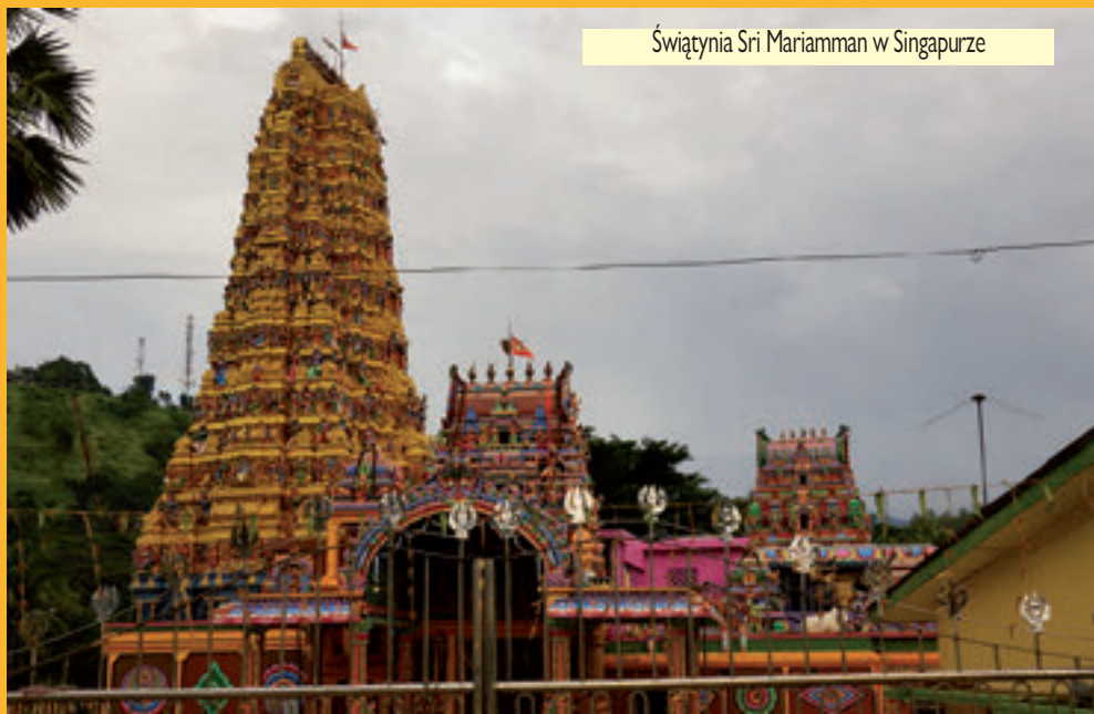
Świątynia Sri Mariamman w Singapurze