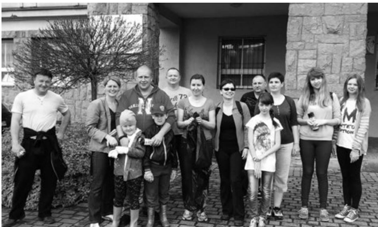
Ekipa sprzątająca w Goleszowie