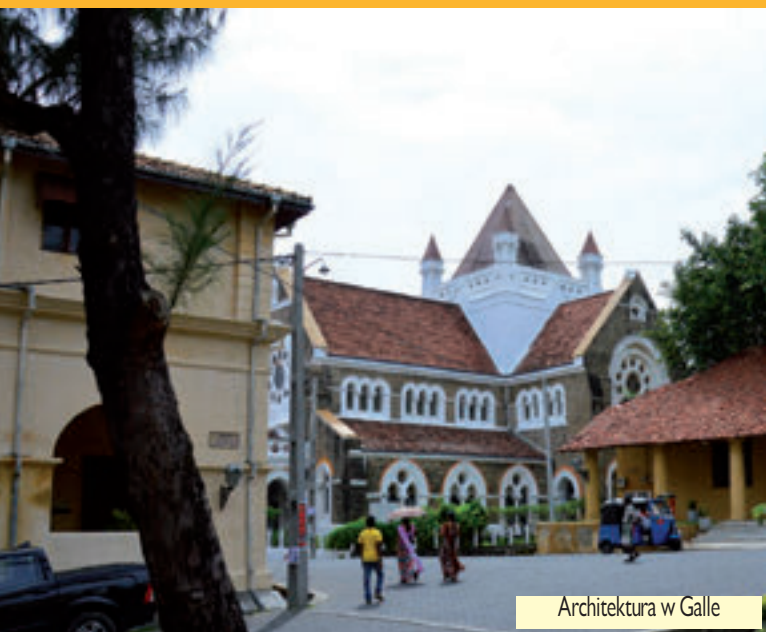
Architektura w Galle