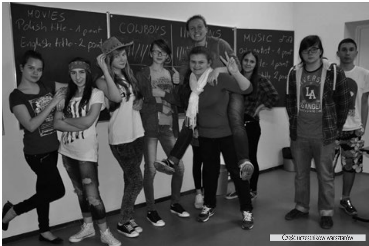
Część uczestników warsztatów