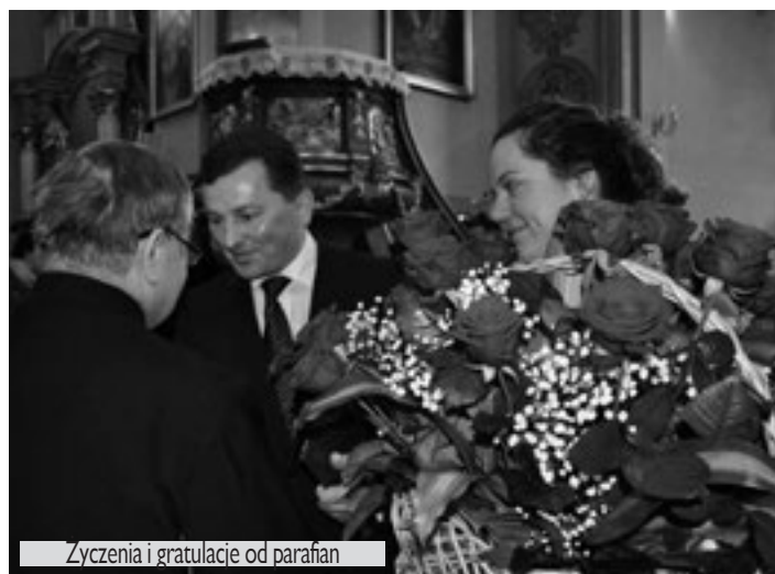
Życzenia i gratulacje od parafian