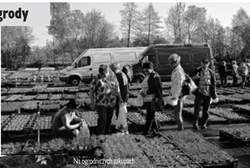
Na ogrodniczych zakupach