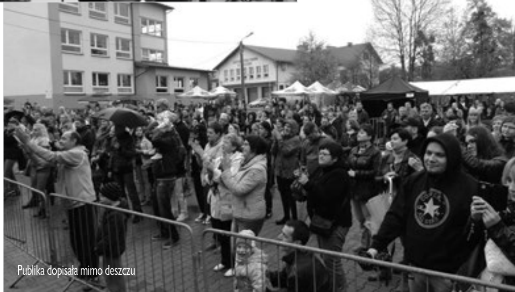
Publika dopisała mimo deszczu

Od 1 maja do 31 maja 2015 w Gminnym Ośrodku Kultury od 9.00-18.00 można podziwiać wystawę science fiction przygotowaną przez Akademię Fantastyki. Jest to świat gwiazdnych wojen, władcy pierścieni, Hobbita i Japonii. Serdecznie zapraszamy! Przegląd Dorobku Kulturalnego TON 2015 będzie dwudniowym przedsięwzięciem, które odbędzie się 23-24 czerwca 2015 r. w godz. od 9.00 do 18.00. Pierwszy dzień będzie warsztatowy, a drugi prezentacyjny i konkursowy.