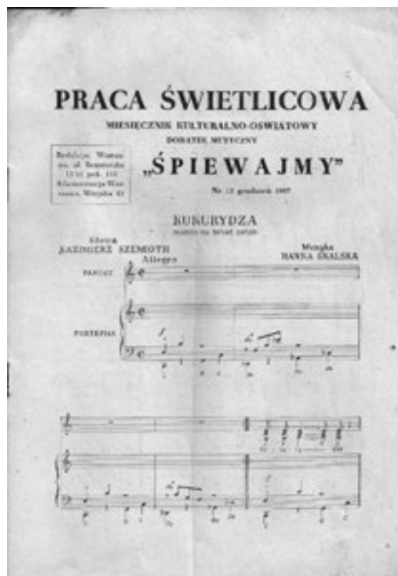
Śpiewnik do pracy świetlicowej z roku 1957