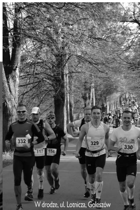
W drodze, ul. Lotnicza, Goleiszów