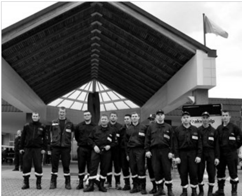
Ekipa z Gminy Goleiszów