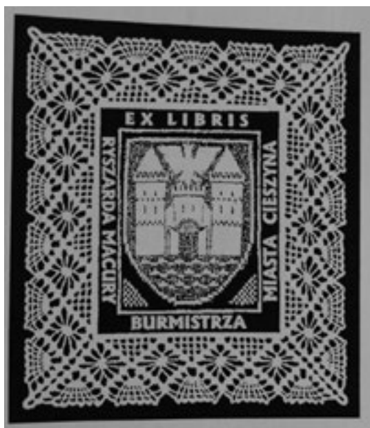
Ex libris burmistrza Miasta Cieszyn (herb Cieszyna, ramka koronkowa)

Mamy nadzieję, że samorządowy miesięcznik „Panorama Goleszowska” także dołączy niebawem do grona właścicieli ekslibrisów.