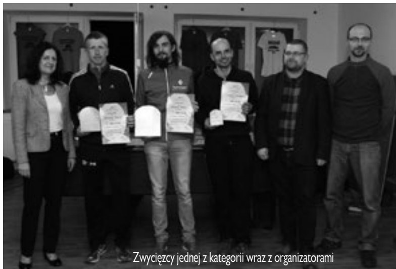
Zwycięzcy jednej z kategorii wraz z organizatorami

impresą objęli: portal www.biegigorskie.pl i www.beskidzka24.pl oraz „Głos Ziemi Cieszyńskiej”.