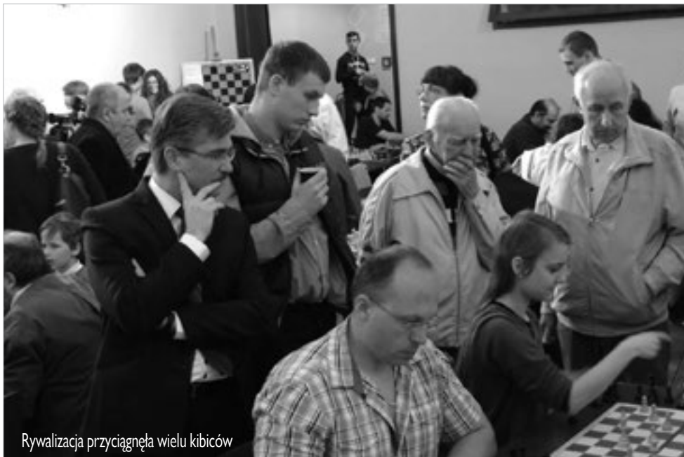
Rywalizacja przyciągnęła wielu kibiców