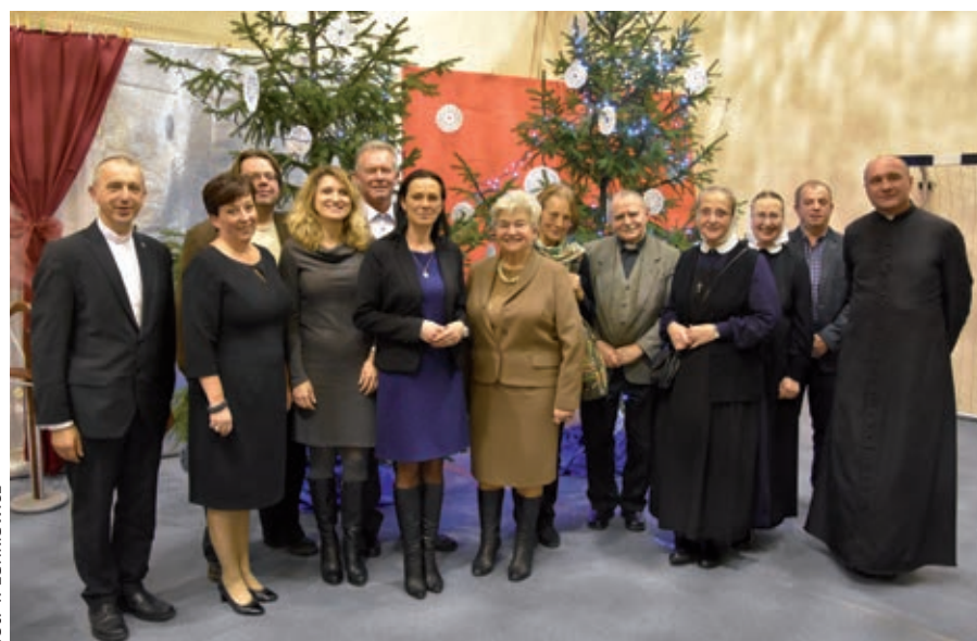
fol. T. Lenkiewicz