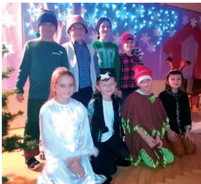
fol. SP Golezów

Tuż przed świętami Bożego Narodzenia w szkole w Kisielowie odbyło się spotkanie jasełkowe z udziałem zaproszonych rodziców i gości. Dzieci, jak co roku, wraz ze swoimi paniami przygotowały przedstawienia, które podkreślały ważne wydarzenie okresu świątecznego. Dziękuję za piękne występy i stroje naszych najmłodszych, a także za wkład wszystkich, którzy pomogli w przygotowaniu tej uroczystości.