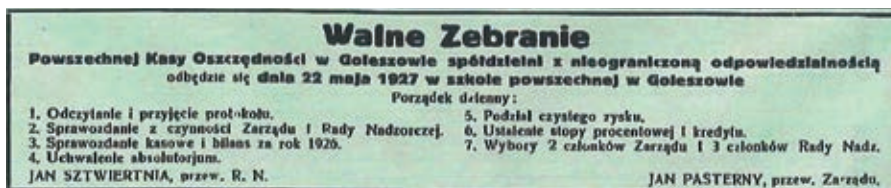
Anons z pisma Rolnik Śląski nr 19 z dnia 15.05.1927 r.

W tym czasie też poszerzono drogi, utwardzono je kamieniem, wybrukowano chodniki. Poprowadzono też kanał ściekowy przez centrum Gole-