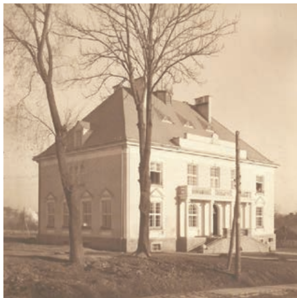
Ratusz w 1929 r.