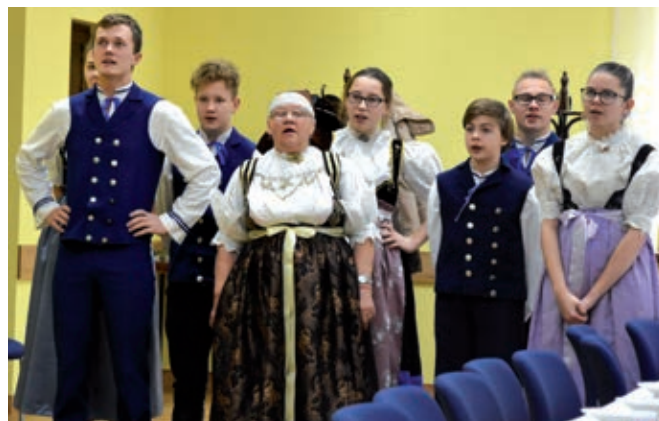
Występ Zespołu Regionalnego „Czantoria”