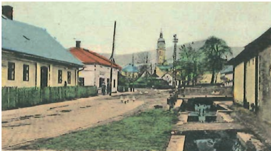
Fragm. pocztówki z 1932 r., dzisiejsza ulica Wolności, z prawej kanał ściekowy