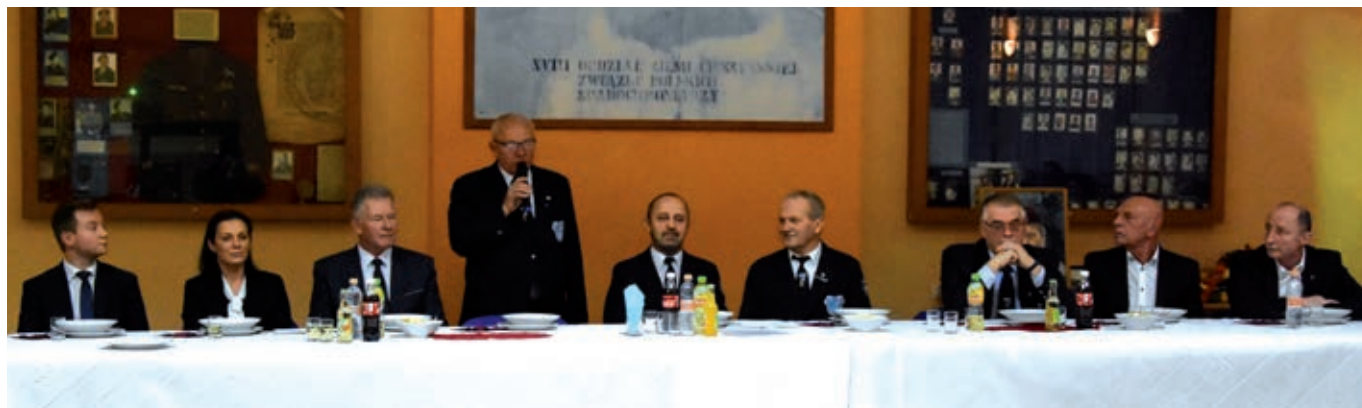
fol. K. Grzybek