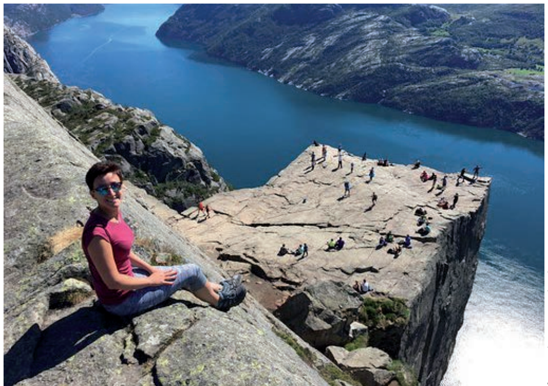
Autorka tekstu i Preikestolen

W następnym artykule zapraszam na trekking do samotnego kamyczka – Kjeragbolten!