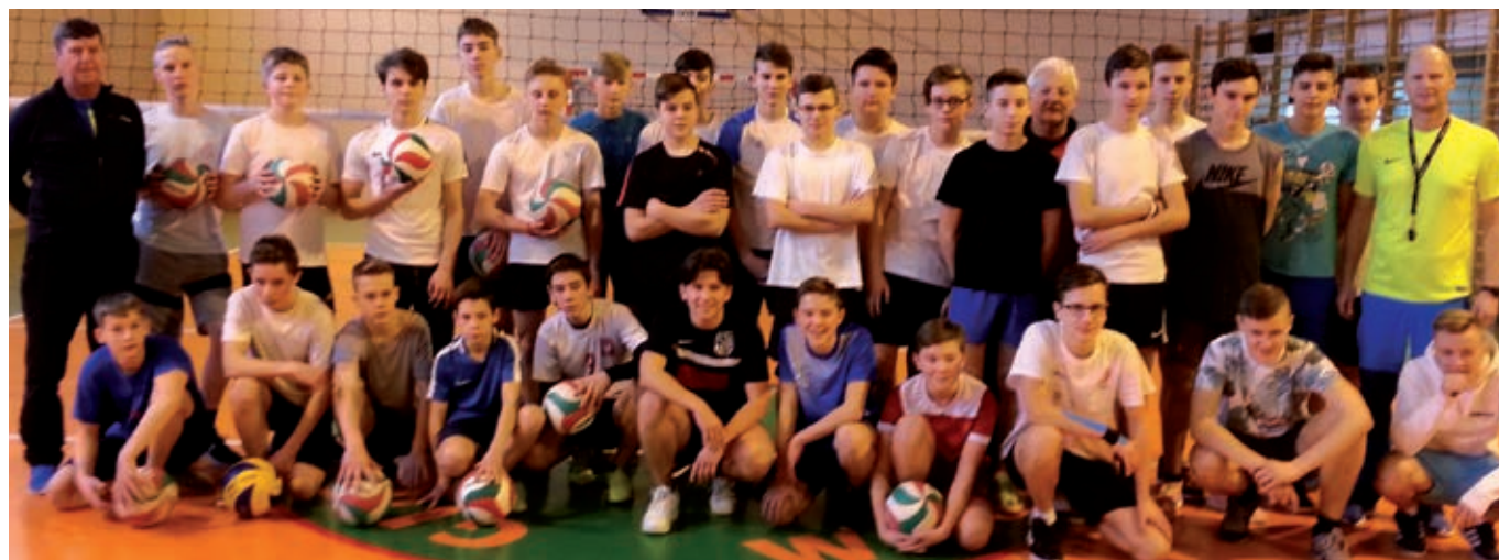
fol. z archiwum „Olimpii”