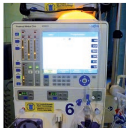
fol. T. Lenkiewicz

Więcej informacji o działalności tej organizacji znajdziecie Państwo na www.fundacja.cieszyn.pl TL