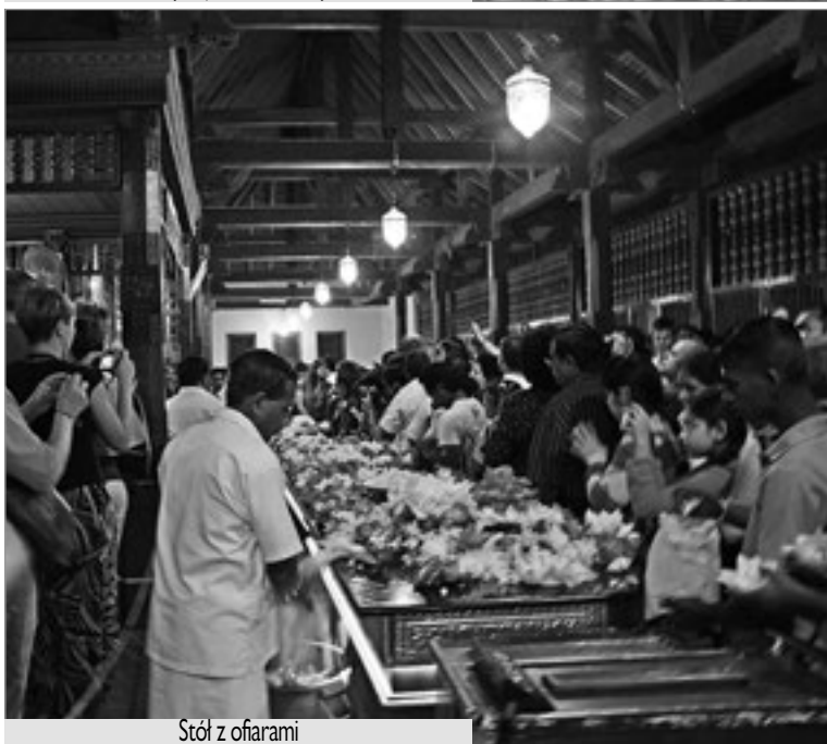
Stół z ofiarami

mycony z Indii we włosach, przez księżniczkę Homamali, lewy górny siekacz Buddy.