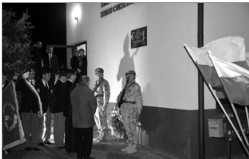
Złożenie wieńca pod tablicą upamiętniającą poległych spadochroniarzy i lotników