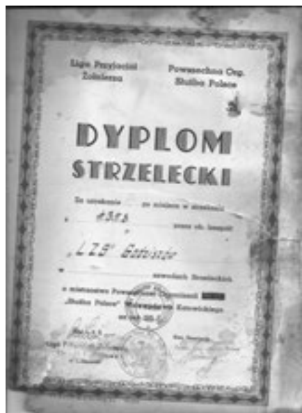
Dyplom z roku 1953 dla LZS Godziszów