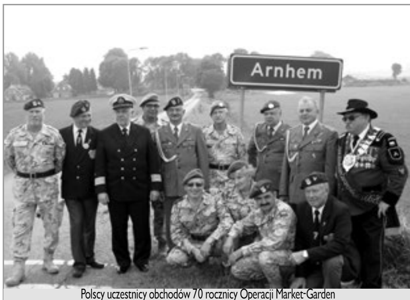
Polscy uczestnicy obchodów 70 rocznicy Operacji Market-Garden

W listopadowy wieczór zaledwie kilka dni po święcie tych, którzy już od nas odeszli, a w przededniu Święta Niepodległości, w Izbie Spadochroniarzy Ziemi Cieszyńskiej w Goleszowie-Równi odbyła się wyjątkowa uroczystość.