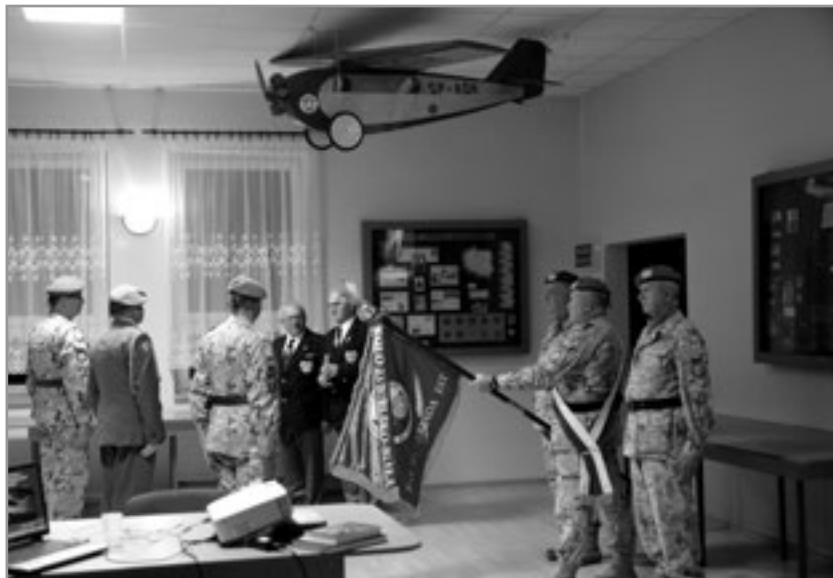
Poczta sztandarowa w Izbie Spadochroniarzy w Goleszowie Równi