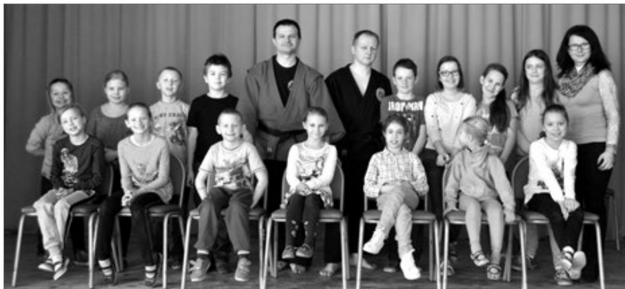
Uczestnicy zimowiska podczas pokazu samoobrony