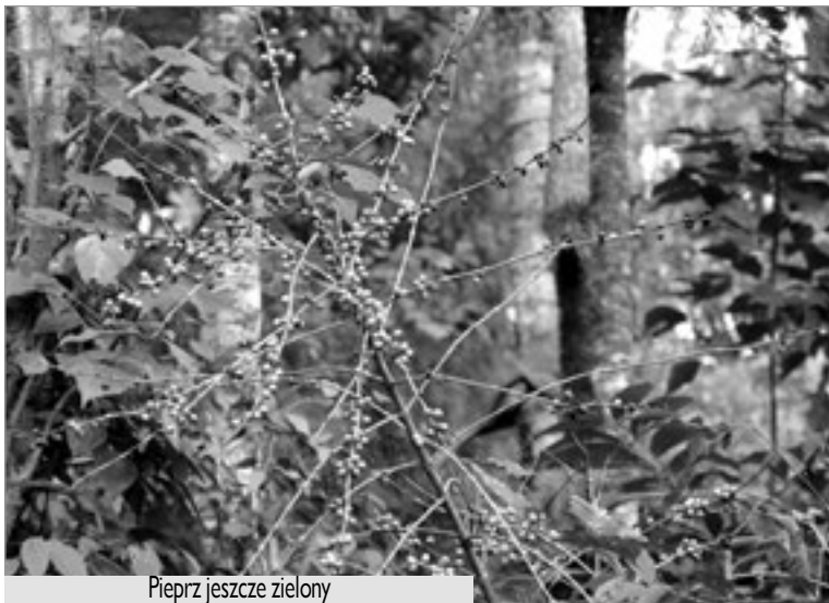
Pieprz jeszcze zielony