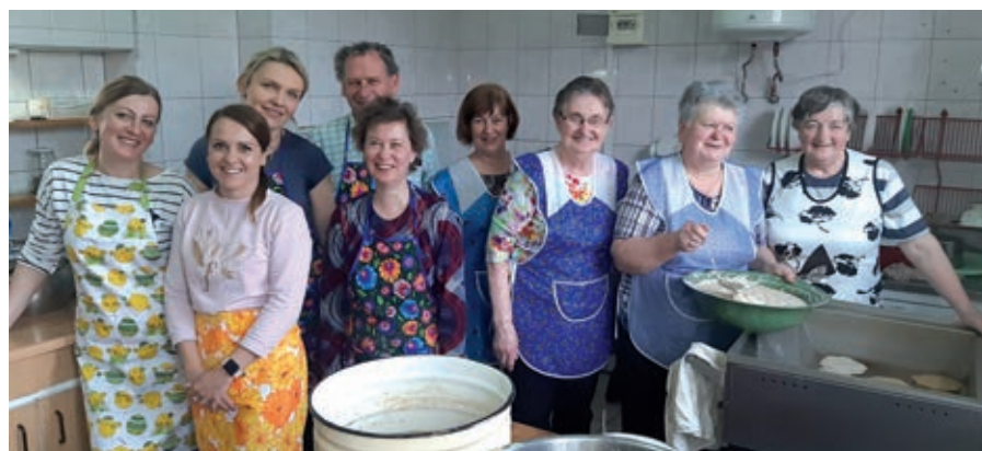
Część osób, które przygotowały kiermasz