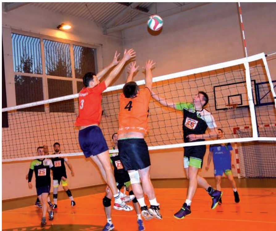
Finałowy mecz Cisownica - ATS