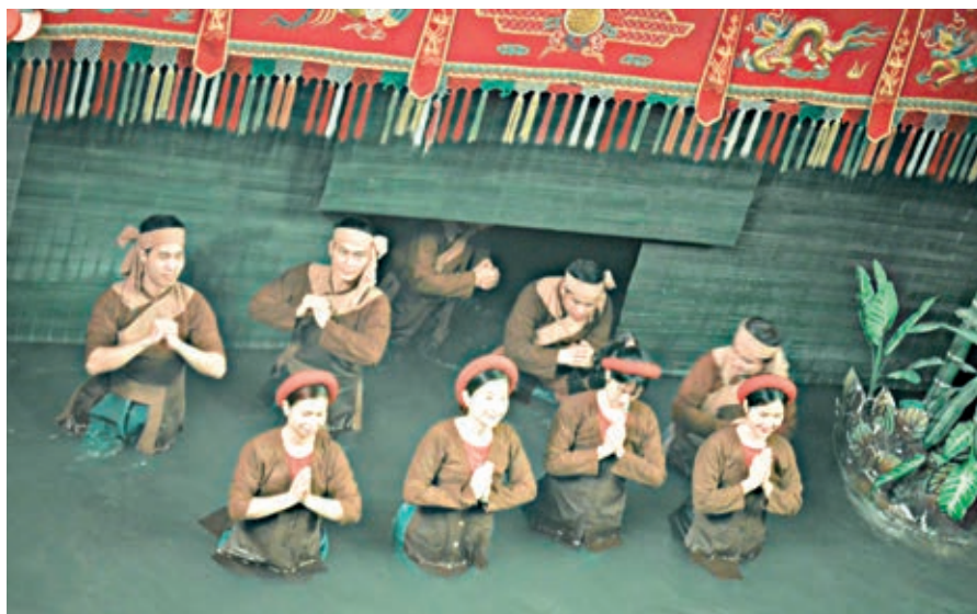
fol. A. Klimczak

z lewej strony mężczyźni, również z instrumentami, grają i śpiewają. Wszystko bardzo oświetlane zmieniającymi się kolorami.