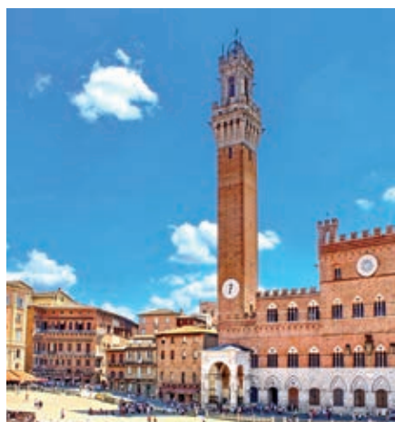
Rynek Piazza del Campo