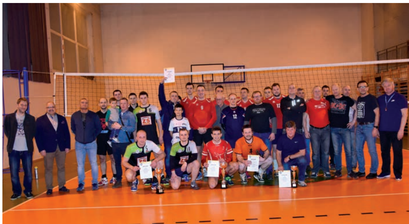
Uczestnicy wręczenia nagród