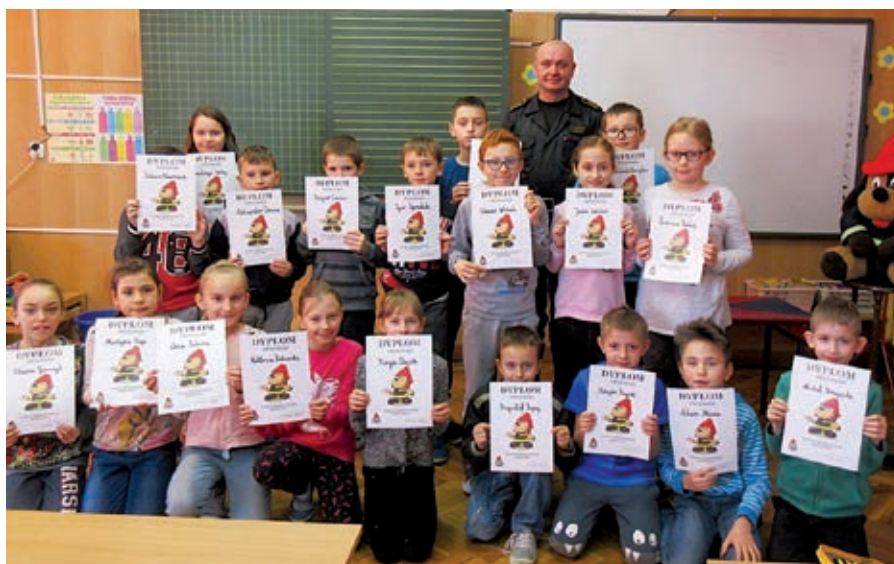
Pamiątkowe zdjęcie z cieszyńskim strażakiem

Dzieci na zajęciach dydaktycznych zapoznali się z zagrożeniami, jakie niesie tlenek węgla, poznali zasady powiadamiania dorosłych o wypadku, zagrożeniu pożarowym czy innym niebezpieczeństwie, powtórzyły numery alarmowe, poznały symptomy zatrucia tlenkiem węgla i utrwaliły zasady udzielania pierwszej pomocy. Na zajęciach kodowania dzieci tworzyły drogi ewakuacyjne różnych budyn-