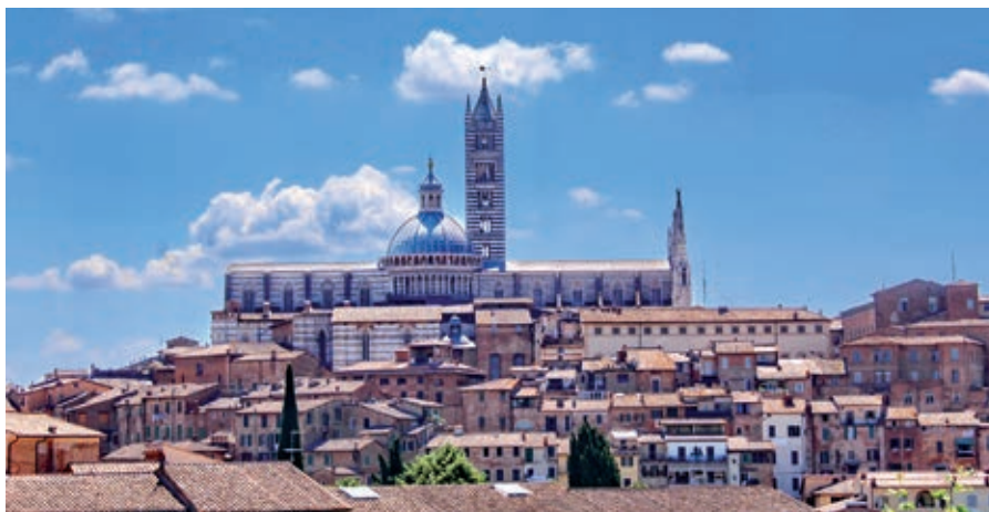
Siena – widok na katedrę

Siena jest jednym z najpiękniejszych średniowiecznych miast Toskanii. Zabytkowe centrum zostało w 1995 roku wpisane na listę światowego dziedzictwa kulturalnego UNESCO. Historycznie Siena była etruskim osiedlem i małym miasteczkiem w okresie antycznym. Miasto liczy około 54 tys. mieszkańców. Według legendy, założyli je synowie Remusa - Senio i Aschio, którzy uciekając przed swym stryjem