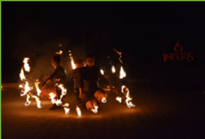
Pokaz Teatru Ognia INFERIS