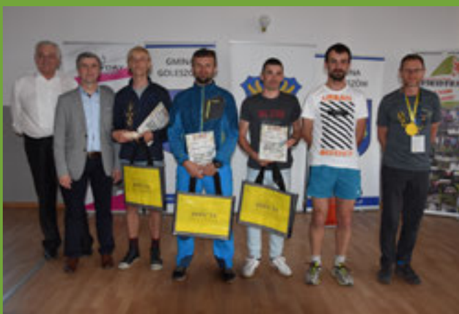
Najlepsi biegacze na dystansie 100 km