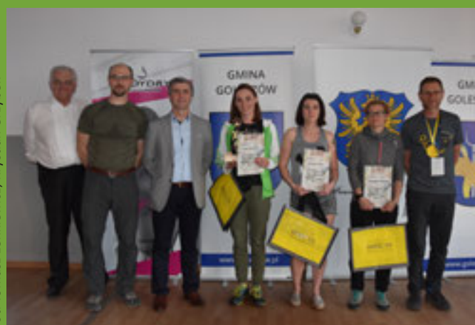
Najlepsze biegaczki na dystansie 100 km