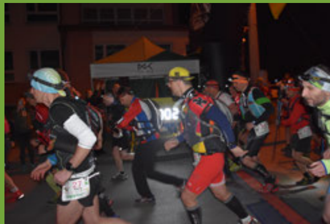
Start - 100 km