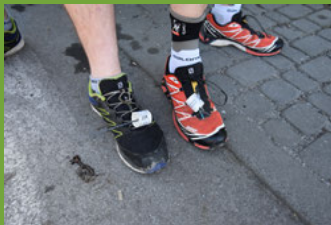
Buty z chipami