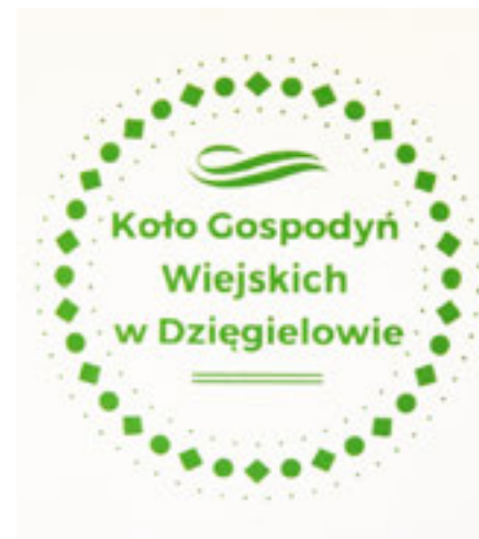
Logo KGW Dzięgielów

W ubiegłym roku miejscowe KGW zrealizowało projekt „Wier w działanie”, w ramach którego przeprowadzono szereg warsztatów np. z haftu wstążeczkowego i cieszyńskiego, tworzenia biżuterii koralikowej, ozdób świątecznych, wypieku ciasteczek. Dzielenie się doświadczeniem, integracja lokalnego środowiska, czy promowanie alternatywnych form spędzania wolnego czasu osób w różnym wieku to najważniejsze z założeń projektu, który zakończył się w listopadzie 2017 r. Efektem zrealizowanego projektu jest strój cieszyński wykonany własnoręcznie przez jego uczestniczki. TL