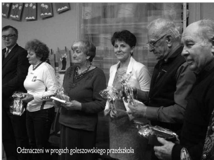
Odnaczeni w progach goleszowskiego przedszkola