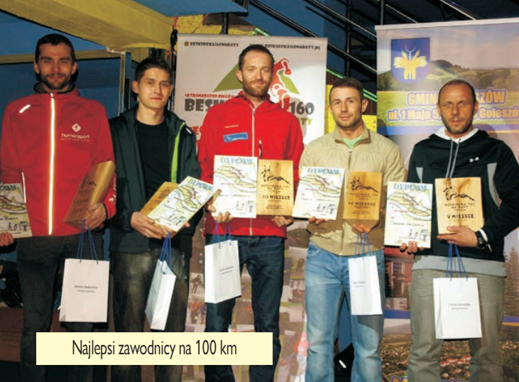
Najlepsi zawodnicy na 100 km