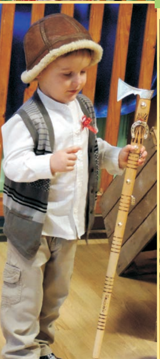
Czytaj str. 17