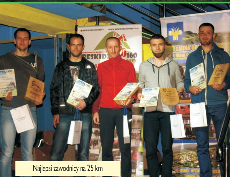
Najlepsi zawodnicy na 25 km