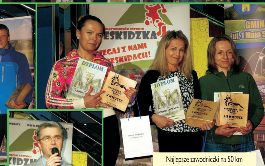
Najlepsze zawodniczki na 50 km