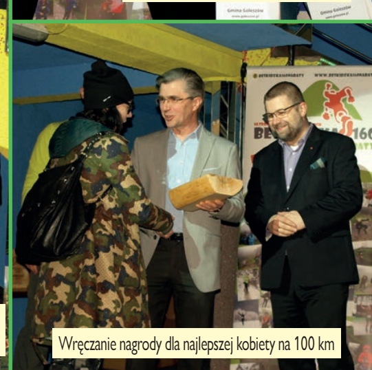
Wręczenie nagrody dla najlepszej kobiety na 100 km