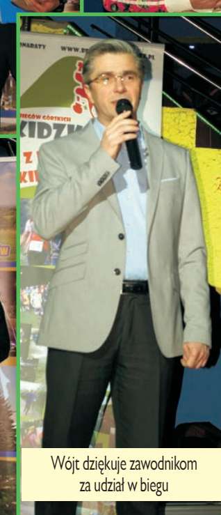
Wójt dziękuje zawodnikom za udział w biegu