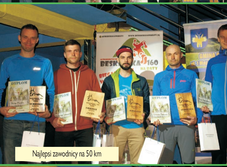
Najlepsi zawodnicy na 50 km