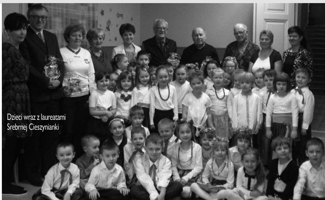
Dzieci wraz z laureatami Srebrnej Cieszynianki

Dzięki współpracy z rodzicami i dziadkami zorganizowano w przedszkolu bogato wyposażony w stare żdźiorba „Kącik regionalny”, który przybliżył dzieciom zastosowanie dawnych przedmiotów codziennego użytku takich jak: kołowrotek, maśniczka, drewniane, bogato zdobione maselniczki, żelozka z duszą, młynki, dzbanki, ubiory i sprzęty sportowe. Bardzo dziękujemy wszystkim, którzy przyczynili się do powstania naszej wystawy!