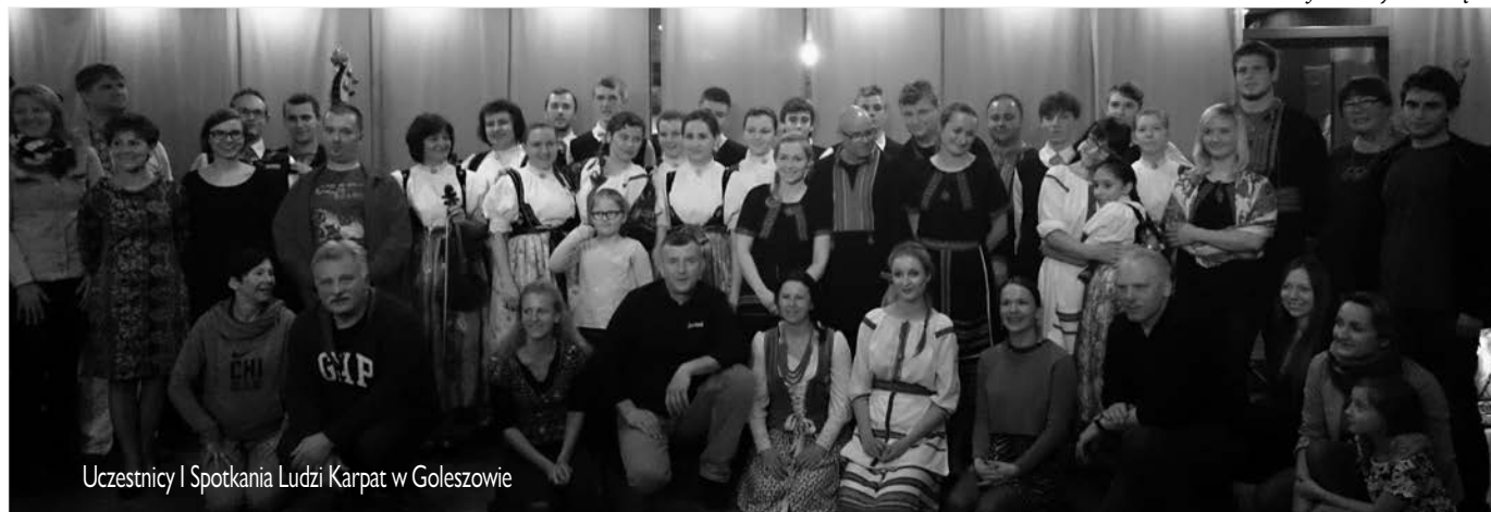
Uczestnicy I Spotkania Ludzi Karpat w Golezowie