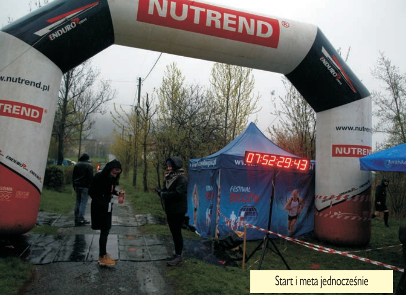
Start i meta jednocześnie