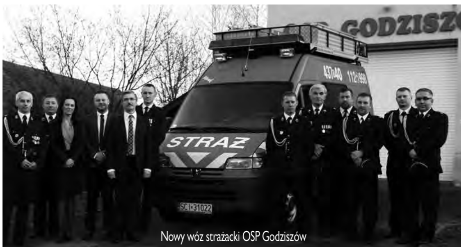
Nowy wóz strażacki OSP Godziszów