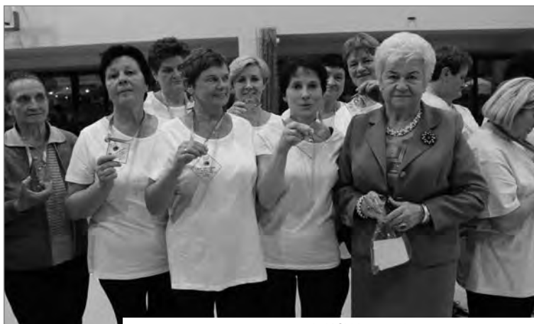
Reprezentantki KGW Dzięgielów

Impreza miała na celu prezentację, zachowanie oraz ochronę tradycji i dziedzictwa kulturowego wsi, poprzez reprezentowanie tradycyjnych zabaw i konkurencji sportowych, a także innego dorobku kulturowego KGW. Organizatorzy chcieli pokazać, że bez względu na wiek i bez użycia drogiego sprzętu specjalistycznego można promować aktywny oraz zdrowy styl życia, a także zapewnić uczestnikom wspaniałą zabawę i integrację środowiska lokalnego. Panie z wielkim entuzjazmem i zaangażowaniem brały udział w konkurencjach, które miały m.in. przypomnieć „Jak się downi na dziedziźnie bawiono”. Były więc: humorystyczna prezentacja drużyny, bieg z jajkiem na łyżce, bieg na nartach trzyosobowych, strzały na bramkę z zasłoniętymi oczami, skoki na piłce, sztafeta w „tunelu”, rzut kapeluszem na odległość, jazda na rowerkach tzw. „górkach” oraz „zabawa z owcami”. Dodatkową konkurencją o nagrodę specjalną (wspaniałą tort) był wyścig w parach połączony z gaszeniem świeczek na tortach-atrapach. Drużyny startowały w 6-osobowych składach (plus dwie rezerwowe) złożonych z pań, członkiń KGW. Kobiety wykazały się niezwykłą pomysłowością w przygotowaniu strojów, były więc zielone żabki, krasnoludki, tancerki i inne zabawne charakteryzacje.