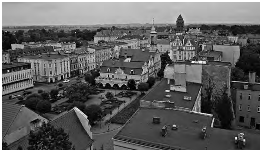
Kluczbork – widok z wieży kościoła