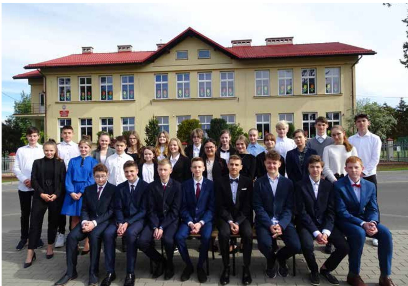
Absolwenci Zespołu Szkolno-Przedszkolnego w Dzięgielowie.