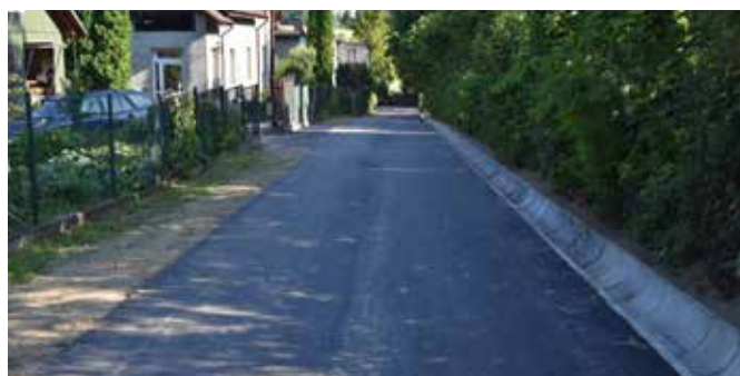
Goleszów, ul. Mostowa.