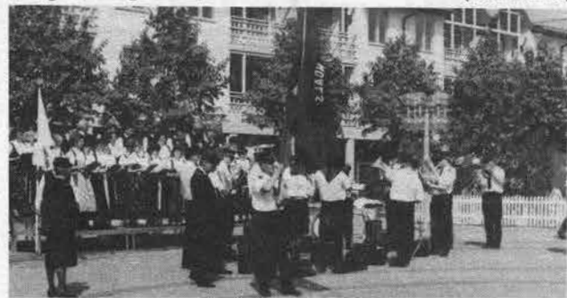
Chór z Goleiszowa i orkiestra Armii Zbawienia przed występem