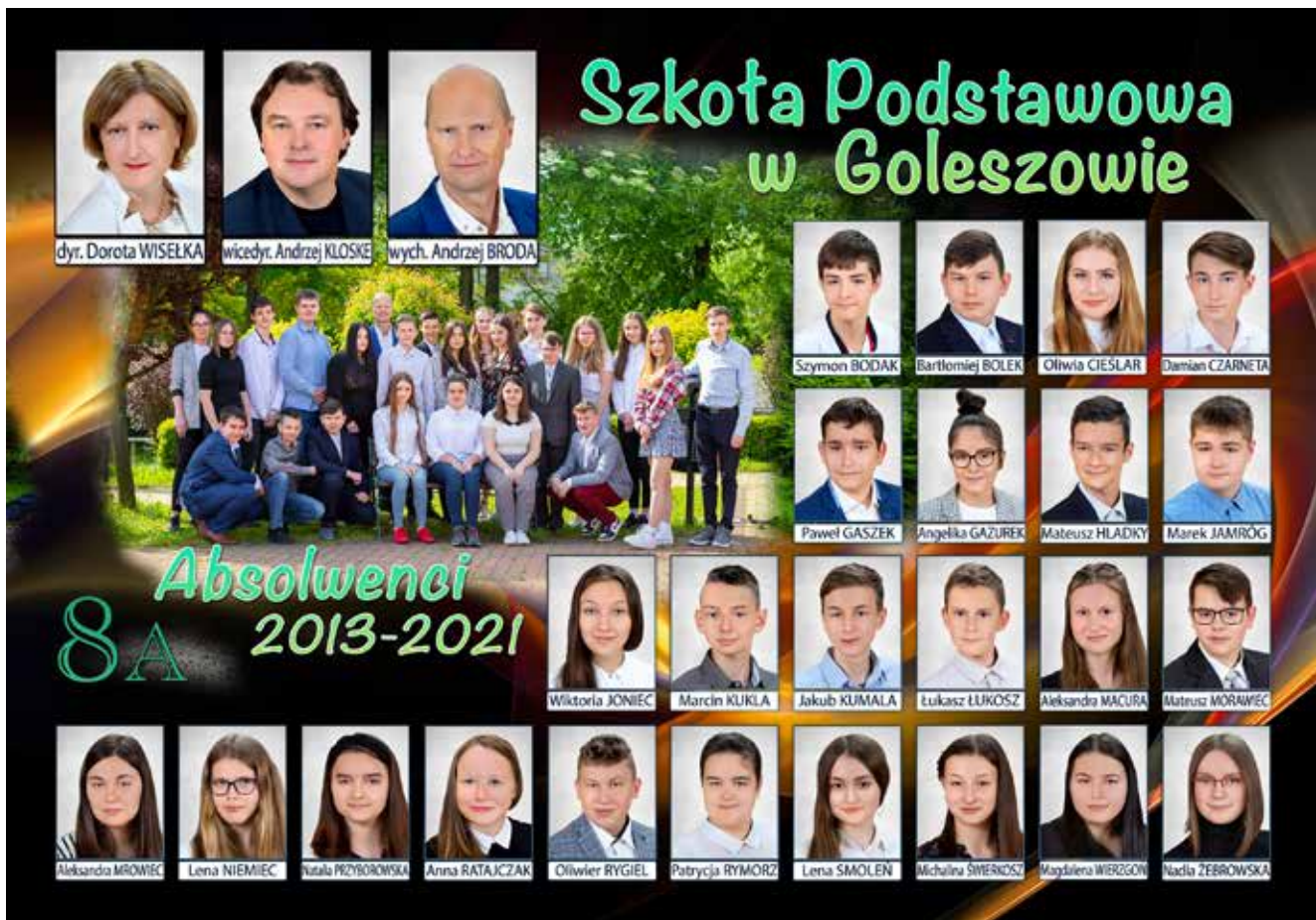
Absolwenci Szkoły Podstawowej w Góleszowie, klasa 8A.