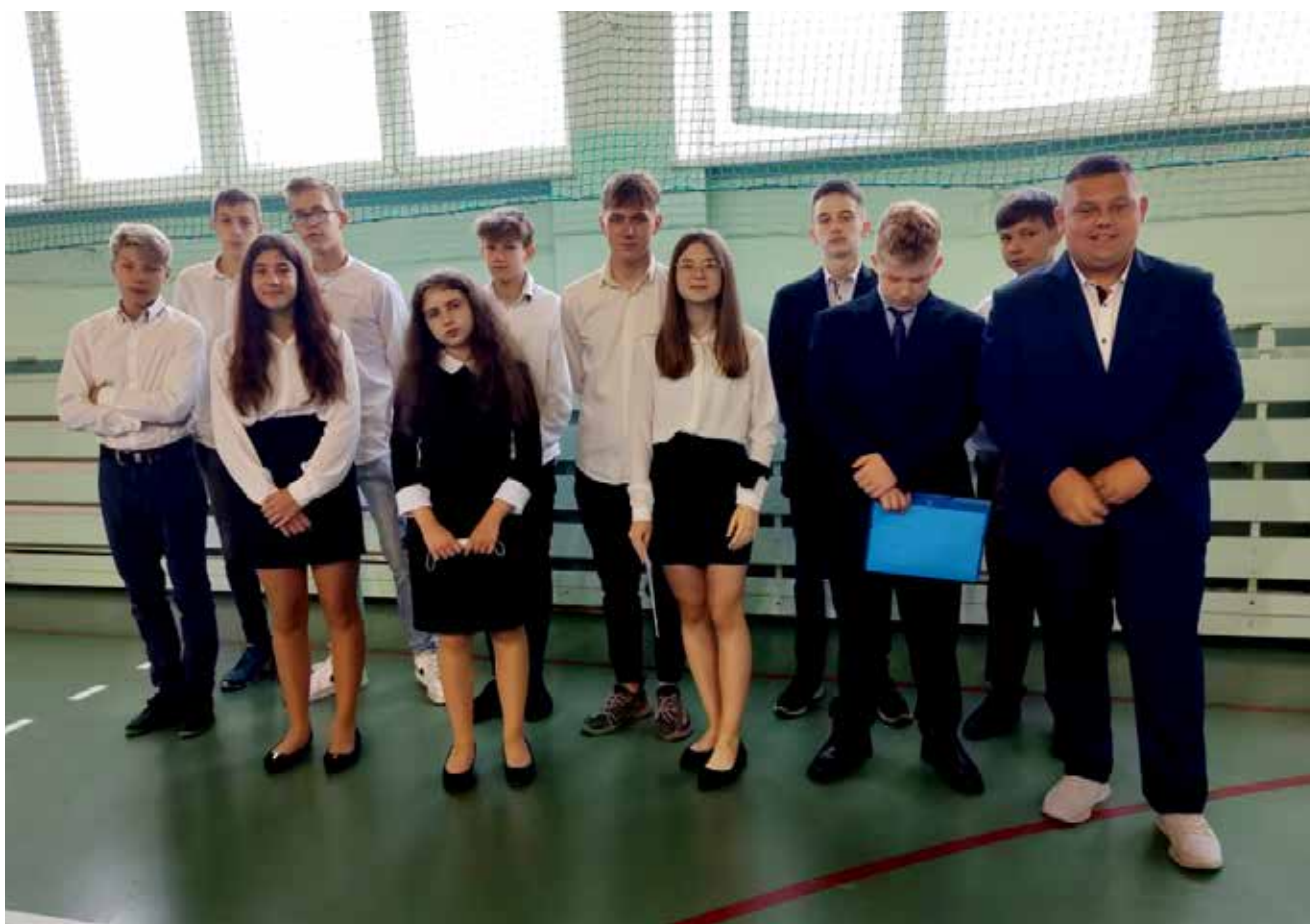
Absolwenci Szkoły Podstawowej w Cisownicy.