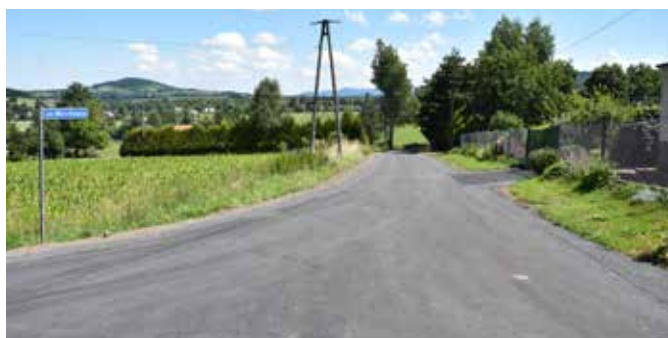
Dziegielów, ul. Miodowa.

— Cieszę się, że efekty kolejnych inwestycji drogowych już są widoczne. Dziękuję mieszkańcom ul. Mostowej w Goleszowie Dolnym oraz ul. Miodowej w Dziegielowie za cierpliwość w oczekiwaniu na efekty prowadzonych prac oraz za podziękowania, które kierowane są zarówno do mnie, jak i pracowników Urzędu Gminy odpowiedzialnych za uwzględnienie remontu tych dróg i jego wykonanie — komentuje Sylwia Cieślarka, Wójt Gminy Goleszów.