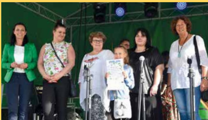
Wręczenie nagród w konkursie na wianki