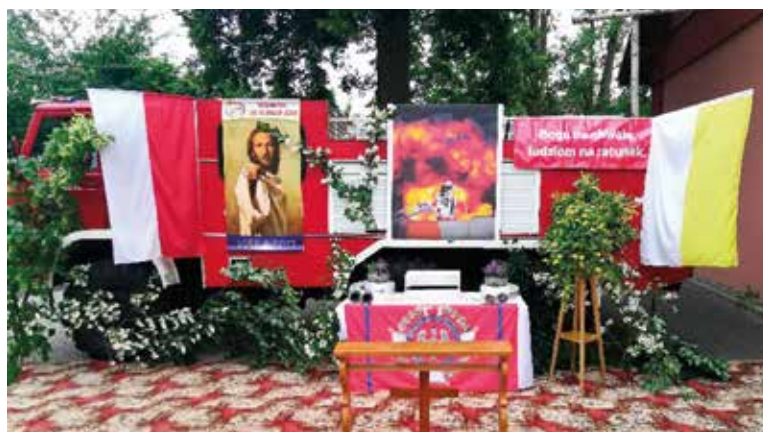
Ołtarz w Lesznej Górnej