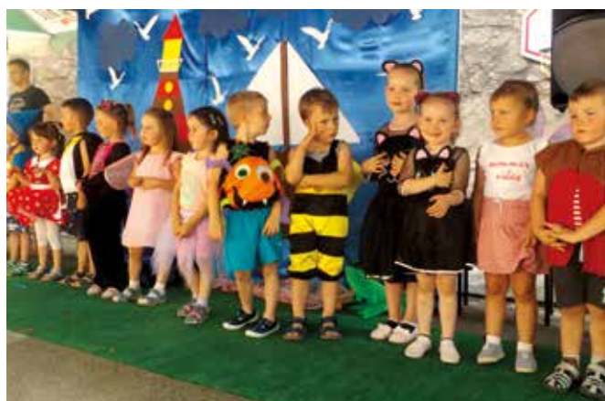
Piknik przedszkolny w Cisownicy