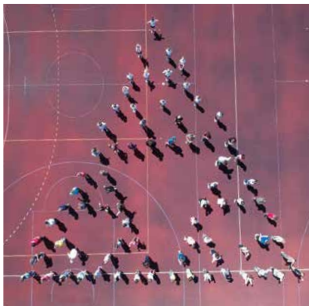
Fraktal utworzony z uczniów cisownickiej szkoły