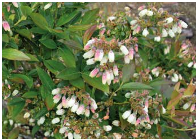
Kwiaty borówki amerykańskiej