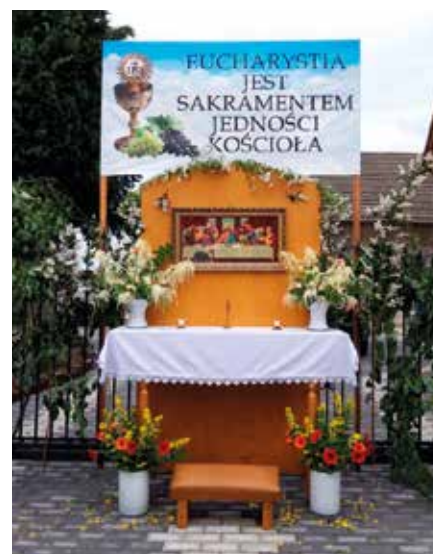
Ołtarz w Kisielowie

20 czerwca odbyły się procesje Bożego Ciała. Na terenie naszej gminy miały one miejsce w Golezowie, Dzięgielowie, Lesznej Górnej i Kisielowie. We wszystkich uczestniczyło kilkaset osób. Każdy z uczestników modlił się przy ołtarzach przygotowanych m.in. przez wiernych, rolników, strażaków czy rodziców dzieci pierwszokomunijnych. Zdjęcia przedstawiają tylko jeden ołtarz z każdej miejscowości.