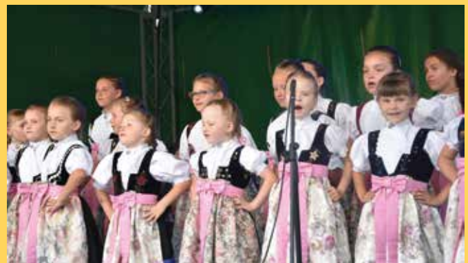
Występ ZPiT „Goleiszów”