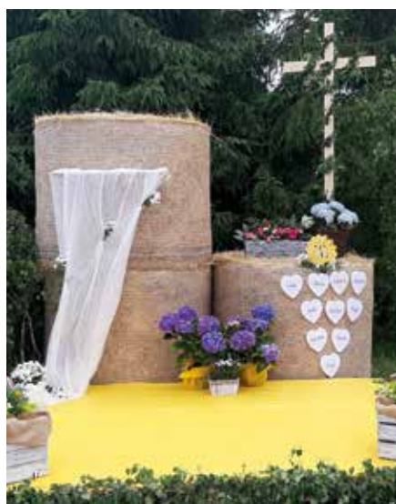
Ołtarz w Dzięgielowie