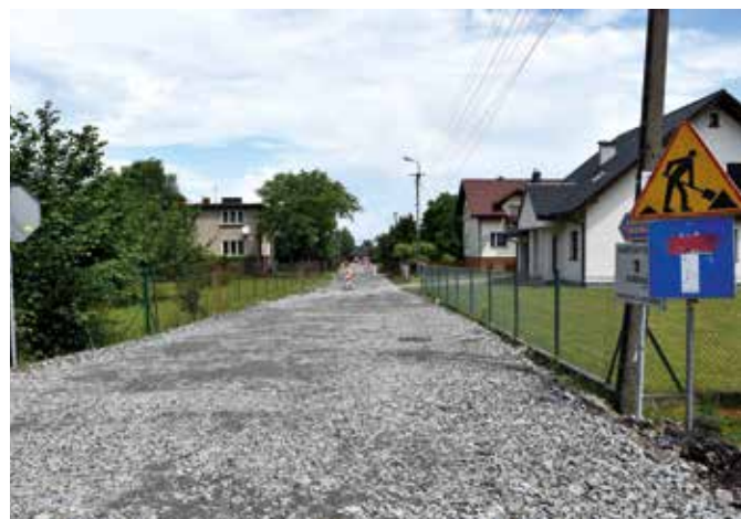
Ulica Osiedlowa w Goleszowie Równi przed końcowymi pracami

Dobiegają końca prace związane z przebudową ul. Osiedlowej w Goleszowie Równi. W ramach zadania wykonano m. in. przebudowę konstrukcji jezdni, budowę kanalizacji deszczowej. W chwili obecnej trwa utwardzanie poboczy kostką brukową. Przed wykonawcą robót jeszcze wykonanie nowej nawierzchni jezdni oraz przywrócenie terenów wokół inwestycji do stanu pierwotnego. W drodze jest już kanalizacja sanitarna, tym samym inwestycja ta pozwoli na kompleksowe zakończenie robót na tej ulicy.