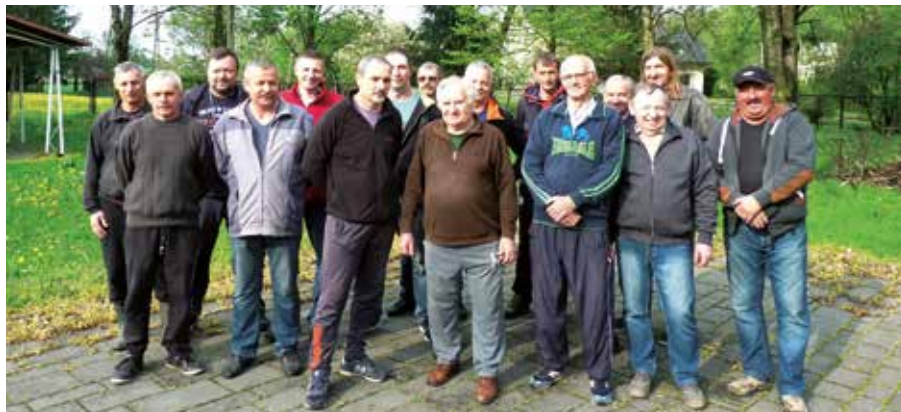
Zjęcie grupowe hodowców sekcji Bażanowice

W 1926 powstało Zjednoczenie Polskich Stowarzyszeń Hodowców Gołębi Poczтовых na Rzeczpospolitą Polską. W czasie II wojny światowej hodowla, a tym bardziej loty gołębi zostały zakazane (ze względu na możliwość wykorzystania do komunikowania się) pod groźbą kary śmierci. Po wojnie, 1 kwietnia 1946 roku reaktywowano Zjedno-