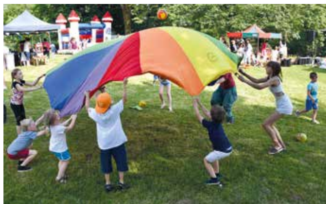
Piknik przedszkolny w Dzięgielowie