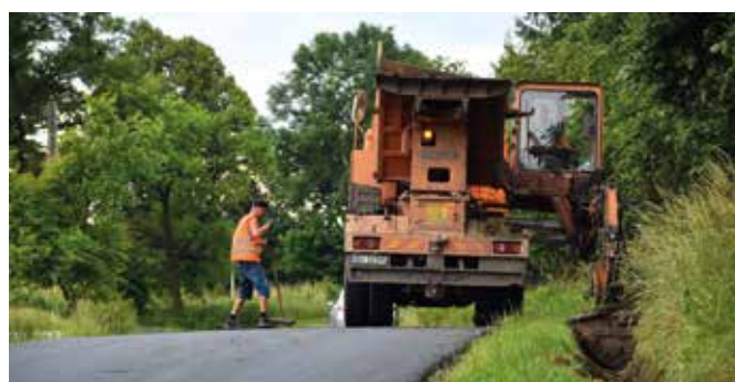
Udrażnianie rowów na ul. Stalmacha w Bażanowicach

UWAGA! Ze względu na parametry istniejącej jezdni, tj. ograniczoną szerokość, a także konieczność wymiany podbudowy jezdni na całym odcinku, konieczne będzie wstrzymanie ruchu pojazdów na ul. Zamkowej. Zamknięcie tego odcinka drogi nastąpi prawdopodobnie w drugiej połowie lipca. W związku z tym wyznaczone zostaną objazdy.