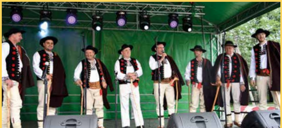
Grupa Śpiewacza „Wańcy”