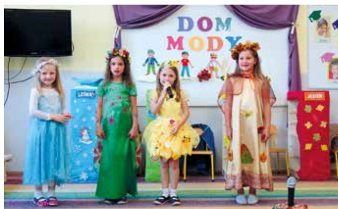
Piknik przedszkolny w Bażanowicach