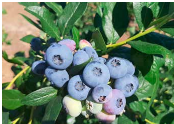
Dojrzewające w Kisielowie owoce borówki amerykańskiej, czerwiec 2019