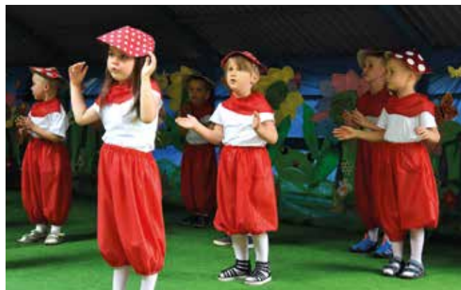
Piknik przedszkolny w Goleszowie