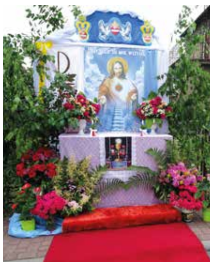
Ołtarz w Golezowie